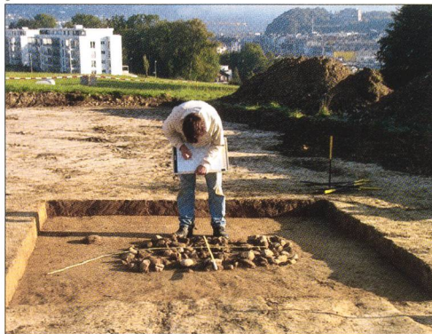
Abb. 7 Oberbuchsiten / Bachmatt. Freilegen der langen Ost-West-Mauer unter dem Parkplatz nördlich des Gemeindehauses.