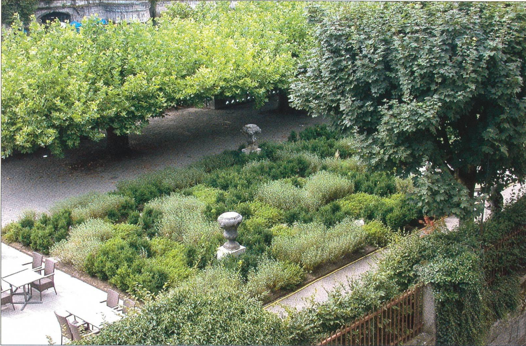
Abb. 8 Solothurn, Palais Besenval, Garten, Zustand nach 2006.

Ausdruck gebracht. Den Wunsch der hoteleigenen Innenarchitekten, hier mit barocken Dekorationselementen zu arbeiten, die historischen Räume jedoch mit einem einheitlichen weissen Anstrich zu «neutralisieren», lehnte die Denkmalpflege kategorisch ab. Gerade die Neuausstattung der einstigen Wohnräume war denn auch das grosse denkmalpflegerische Problem (Abb. 5, 6).