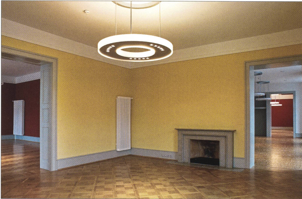
Abb. 6 Solothurn, Palais Besenval, Raumfolge auf der Südseite im Erdgeschoss, Zustand nach 2006.