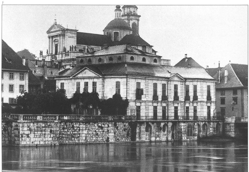
Abb. 1 Solothurn, Palais Besenval, Zustand um 1900/1905.

Johann Viktor II. Besenval, der in Frankreich eine militärisch-diplomatische Karriere bis zum General absolvierte, brachte aus Frankreich den neuartigen Gebäudetypus eines Hôtel «entre cour et jardin»