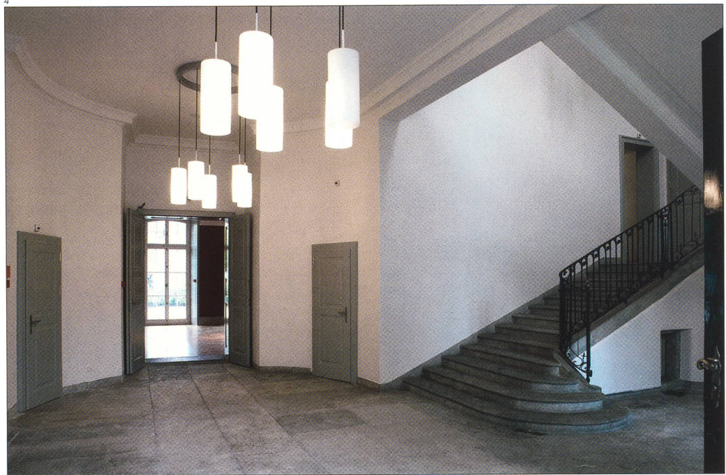
Abb. 5 Solothurn, Palais Besenval, Gartensaal Erdgeschoss, Zustand nach 2006.