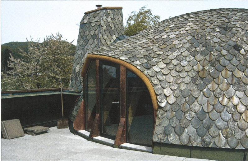
Abb. 10 Ursprünglicher Ausgang von der Südkuppel auf die Terrasse.