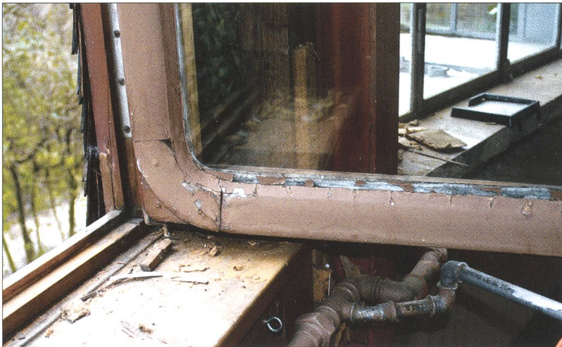
Abb. 6 Blick in das Innere einer Kuppel, nach der Restau- rierung 2008.