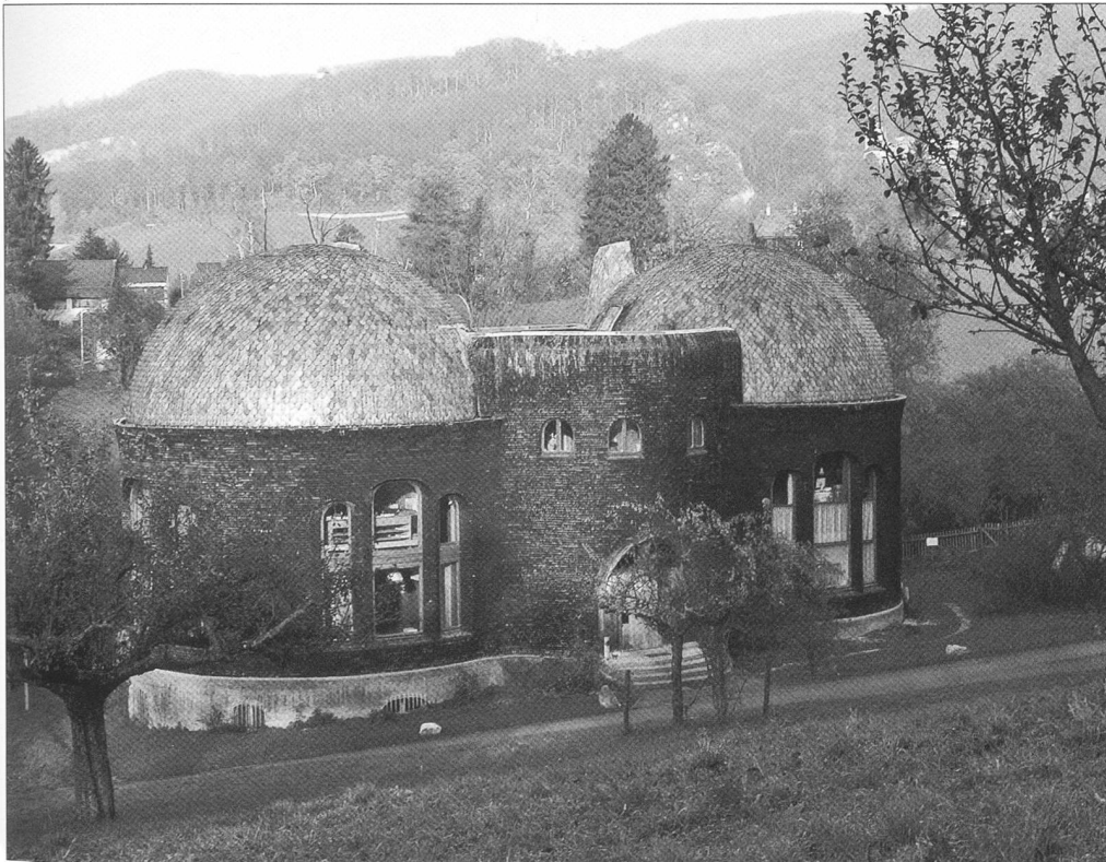
Abb. 1 Dornach, Glashaus beim Goetheanum. Zustand vor der Restaurierung 2008.

Im Zusammenhang mit der ersten Etappe der Betonsanierung stellte der Kanton Solothurn das Goetheanum in Dornach bereits 1994 im Einvernehmen mit der Allgemeinen Anthroposophischen Gesellschaft Goetheanum unter kantonalen Denkmalschutz. Neben dem Hauptbau befinden sich auf dem Goetheanum-Gelände mehrere noch von Rudolf Steiner entworfene Bauten. Diese Bauwerke bringen den ursprünglichen architektonischen Gestaltungswillen Steiners unmittelbar zum Ausdruck. Es ist deshalb von grossem Interesse nicht nur für die Anthroposophische Gesellschaft, sondern auch für die europäische Architekturgeschichte, dass diese Bauten der Nachwelt in möglichst originalem Zustand erhalten bleiben.