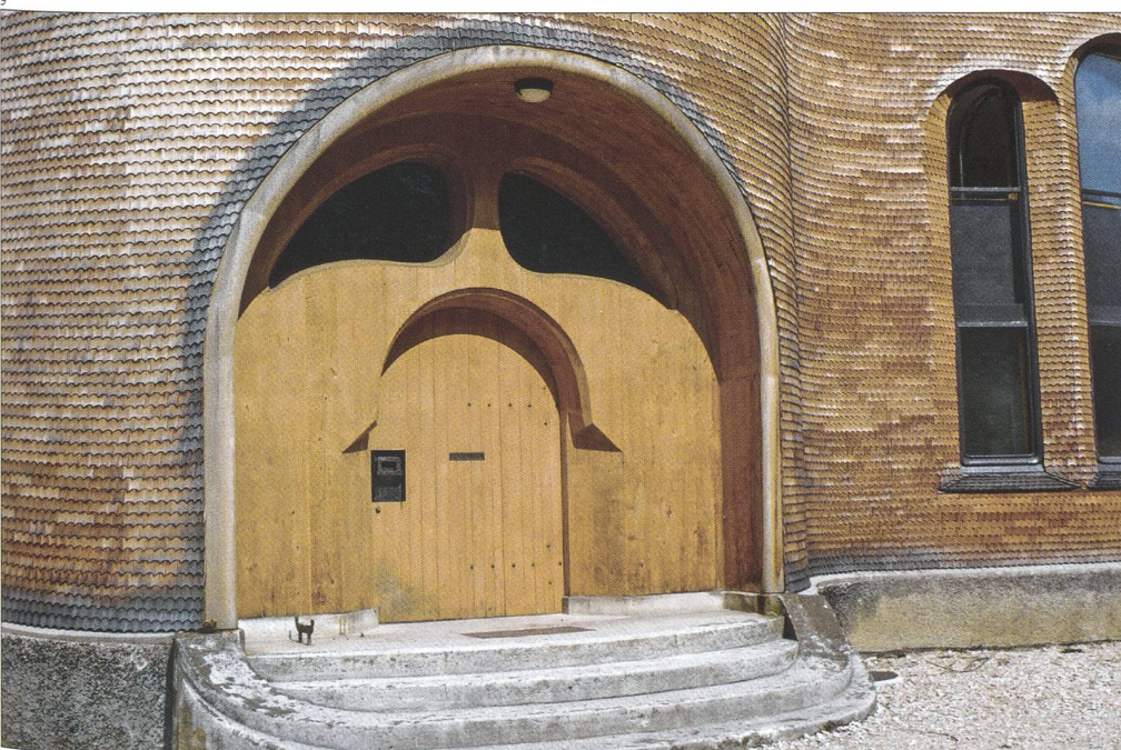
Abb. 9 Eingangsportal nach der Restaurierung 2008.