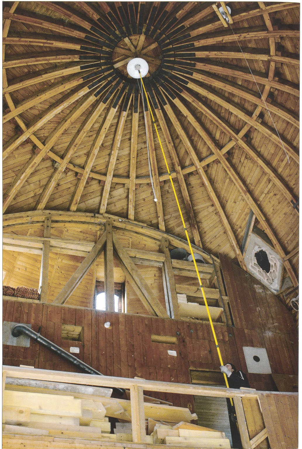
Abb. 2 Inneres eines Kuppelraumes während der Restaurierung.

Beispiel anthroposophischer Auffassung von technischen Gebäuden geschaffen. Hier finden die Elementarkräfte Feuer, Kohle und Rauch ihren unmittelbaren Ausdruck in der architektonischen Form. Es handelt sich möglicherweise um den ersten Vollbetonbau in der Schweiz.