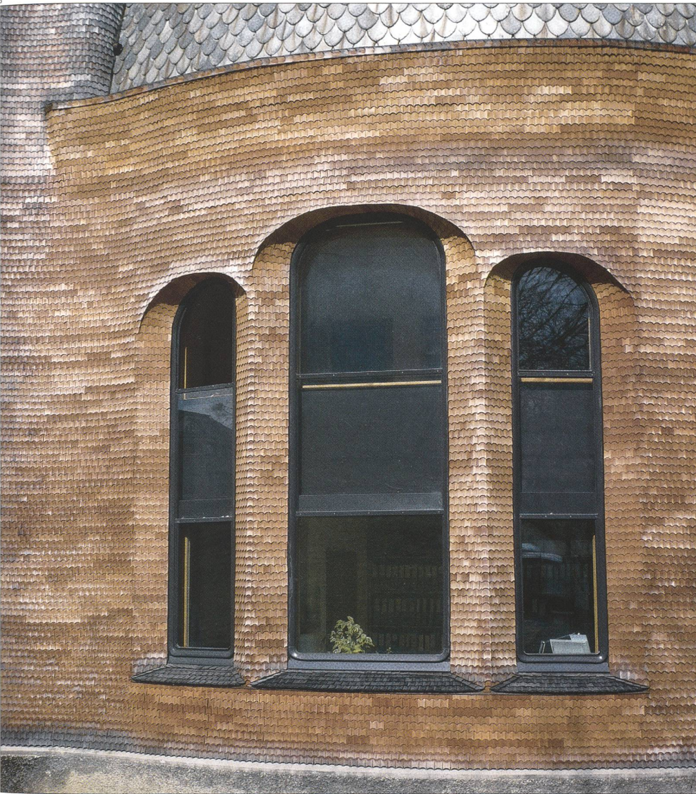
Abb. 8 Fenster nach der Restaurierung 2008.