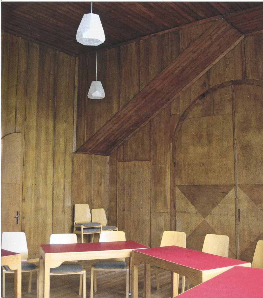
Abb. 5 Ansicht des Konferenzraumes zwischen den beiden Kuppeln.