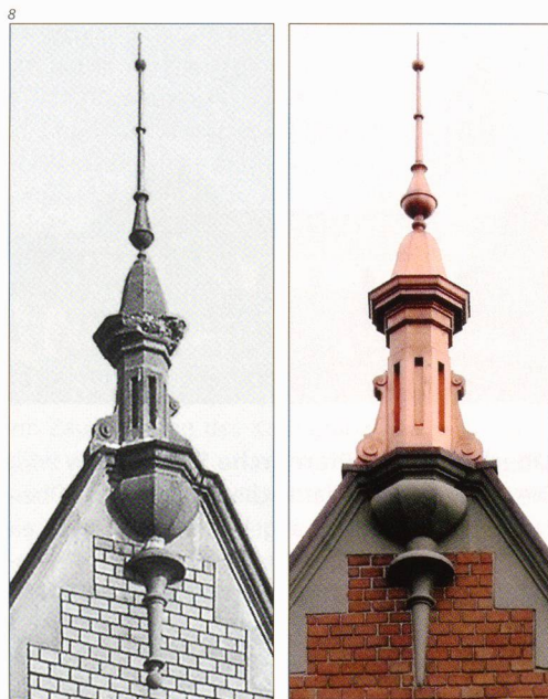
Abb. 9 Rodersdorf, Biederthalstrasse 2, nach der Restaurierung 2009.