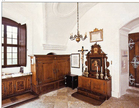
Abb. 10 Rüttenen, Einsiedelei St. Verena, Eremitenhäuschen, nach der Restaurierung 2009.