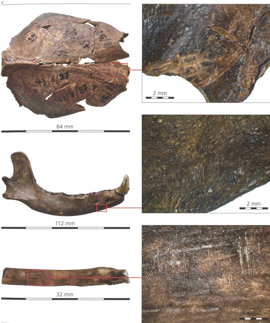
Abb. 4 Schnittspuren am Schädel (a), am Unterkiefer (b) und an einem Mittelfussknochen (c) des ersten Hundeskelettes lassen darauf schließen, dass dem Hund das Fell abgezogen wurde.

werden daher zusammengefasst), das Hausschwein und das Huhn. Die Fundmengen an Nutztierknochen sind aber gering, und die einzelnen Arten sind unter den bestimmaren Knochen mit Fragmentanteilen von nur knapp 1 bis 3 Prozent vertreten. Nach Knochengewicht ist das Hausrind mit rund 25 Prozent mit Abstand am besten repräsentiert.