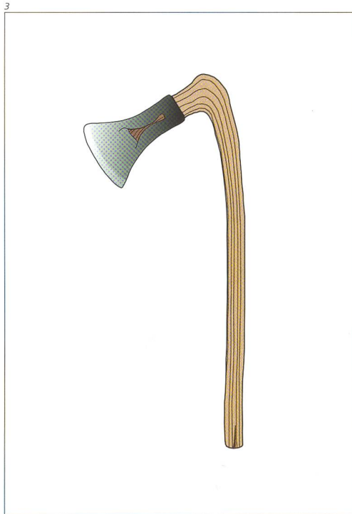
Abb. 3 Tüllenbeil mit Knieholm: So wurde die Klinge geschäftet.

nicht unbedingt für die zweite Hypothese, da gerade Kettenglieder öfters auch bei Weihe- und Opfergaben zu finden sind (mündlich St. Schreyer, KA ZH). Letztlich lässt sich natürlich auch nicht ausschliessen, dass die Beilklingen bei Waldarbeiten verloren gingen. Trotzdem möchten wir, bei aller Vorsicht, der ersten Variante den Vorzug geben und die Beile als Weihe- und Opfergaben für eine unbekannte keltische Gottheit interpretieren.