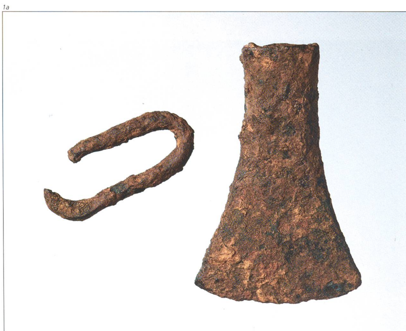
Abb. 1 Das Tüllenbeil mit dem Kettenglied aus Beinwil/Girlang; a) Vorderseite, b) Rückseite. M 2:3.

Auffallend ist, dass beide Fundstellen an einem alten Weg über einer tiefen Schlucht und nahe der Grenze zwischen zwei Gemeinden liegen. Die Gemeindegrenzen geben wohl nicht gerade eine «keltische Flureinteilung» wieder, nehmen aber wahrscheinlich auf topografische Begebenheiten Rücksicht. Die beiden Beile gelangten vermutlich nicht zufällig an diesen Stellen in den Boden.