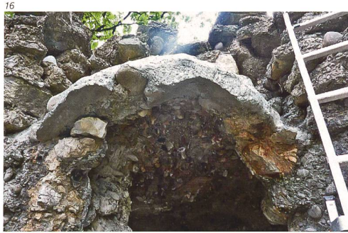
Josef Ineichen, Rapperswil

Abb. 16 Östlicher Grotteneingang, Sanierung des instabilen Sturzes. Auf die neu ange- brachte Armierung wird die Form des Sturzes aufge- mörtelt.