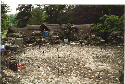
Josef Ineichen, Rapperswil

Abb. 18 Auf der Plattform werden die Hohlstellen zwischen dem originalen Boden und dem nachträglich eingebrachten Deckbelag mit Mörtel ausge- gossen. Die Standorte der Einlaufschläuche wurden durch Abklopfen der Ober- fläche (Hohlräume) bestimmt.