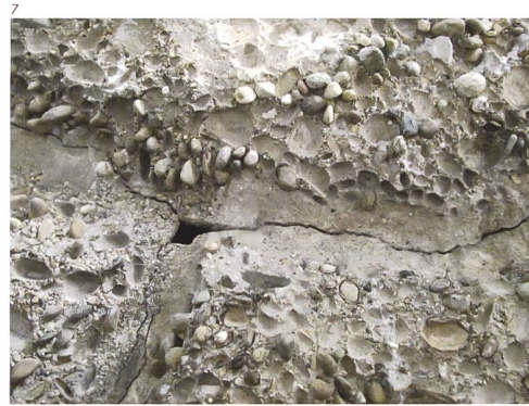
Kant. Denkmalpflege, Urs Bertschinger

Erstmals konnte damit die Art und die Abfolge der ursprünglichen Konstruktion des Gewölbes sichtbar gemacht werden: 3 Als erster Arbeitsgang wurde ein Lehrgerüst erstellt, das bereits die Unregelmässigkeiten des späteren Gewölbes aufweisen musste. Darauf legte man ein regelmässiges, feucht gehaltenes Sandbett, in welches im gewünschten Muster die verschieden grossen und farbigen Kieselsteine, welche die Untersicht der Grotte bilden sollten, gelegt wurden (mehr dazu im Kapitel über die Oberflächen). Als Träger wurde über die Kieselsteine in einer Dicke von rund 5 Zentimetern ein kalkhaltiger Mörtel mit einer Sandkörnung von bis zu 5 Millimetern gegossen. Eine Zementschlämme als Haftbrücke mit einer darin eingelegten Armierungsnetzeinlage von 3 Millimeter Durchmesser führte weiter zur eigentlichen Tragkonstruktion des Gewölbes. Diese wurde aus zirka 14 Zentimeter dickem Stampfbeton mit einer Kieskörnung bis zu 30 Millimetern erstellt, in der Mitte als Verstärkung ein Armierungsnetz von 5 Millimeter Durchmesser.