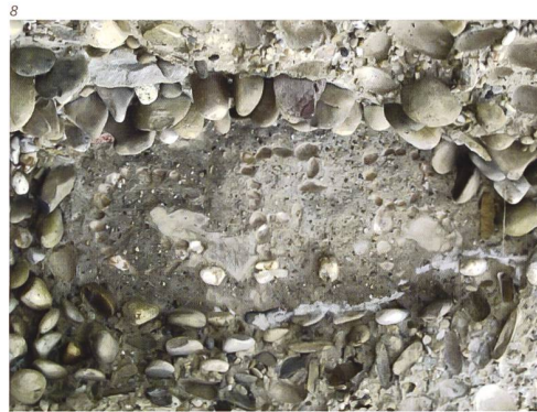
Kant. Denkmalpflege, Urs Bertschinger