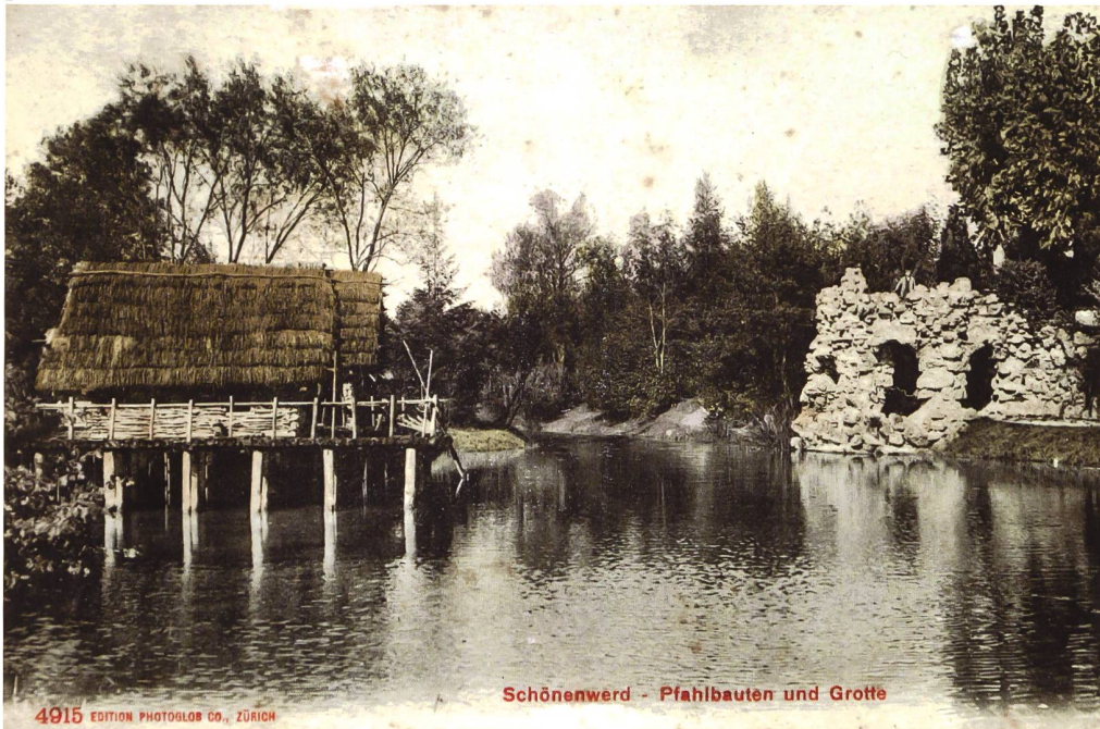
Abb. 2 Die Postkarte von 1908 (Stempel) zeigt die Felsgrotte rund fünfzehn Jahre nach ihrer Vollendung. Davor im Wasser befindet sich das Pfahlbaudorf.