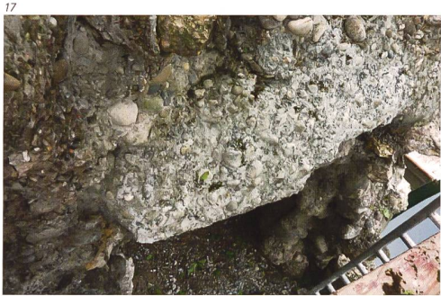
Josef Ineichen, Rapperswil

Abb. 17 Östlicher Grotteneingang, Sanierung des instabilen Sturzes. In den Mörtel werden der Umgebung angepasste Kieselsteine eingedrückt. Der neue hellere Mörtel wird mittels Retuschen dem alten Mörtel angepasst.