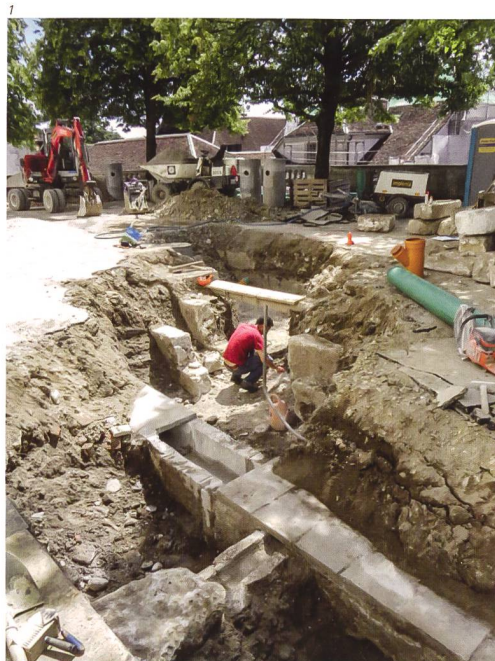
Abb. 1 Ein Mitarbeiter der Kantonsarchäologie Solothurn untersucht die Mauerreste der Friedhofsanlage. Im Vordergrund die Abwasserkanäle des 19. Jahrhunderts.