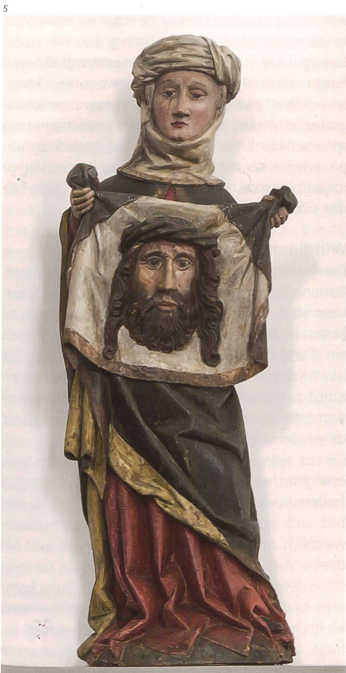
Kant.: Denkmalpflege Solothurn.