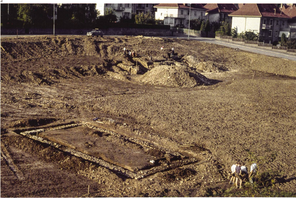
Abb. 4 Blick auf den «Dreispietz» im September 1961. Im Vordergrund das Nebengebäude B, oberhalb davon die Steinansammlung E. Im Hintergrund ist die Freilegung des Hauptgebäudes A noch in vollem Gange.