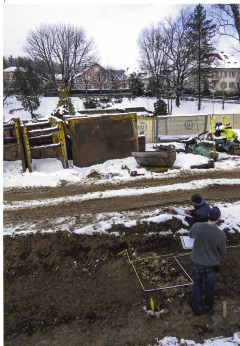
Abb. 1 Baubegleitung im Februar 2015. Mitarbeiter der Kantonsarchäologie dokumentieren ein Fundament des Nebengebäudes D. Im Hintergrund ist oberhalb der Baustellenabschrankung eine rekonstruierte Mauer des Hauptgebäudes zu erkennen.

Bereits zwischen den Jahren 1923 und 1942 liessen verschiedene Fundmeldungen in der Umgebung des Föhrenwegs eine römische Siedlungsstelle vermuten. 1961 brachte dann die Umgestaltung des «Dreispitzes» in einen Park Teile eines römischen Gutshofs zum Vorschein (Abb. 2). Die Bauarbeiten ebneten das bislang als Spielwiese und als Pflanzgärten genutzte Areal zwischen Föhrenweg, Untergrundstrasse und Katzenhubelweg ein und brachten die Südfront des Herrschaftshauses A sowie das Nebengebäude B zu Tage (Abb. 3). Die Villa war in den Hang hinein gebaut und besass eine 16 Meter lange und 5 Meter tiefe Portikus mit zwei seitlich vorspringenden Eckbauten (Abb. 2). 1,8 Meter dicke Strebe- Pfeiler stützten die beiden 8,5 beziehungsweise