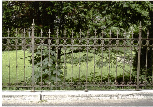
Abb. 2 Biberist. Das Kalksteinkreuz an der Verzweigung Schulweg/ Bachstrasse nach der Restau- rierung, Detailaufnahme 2016.