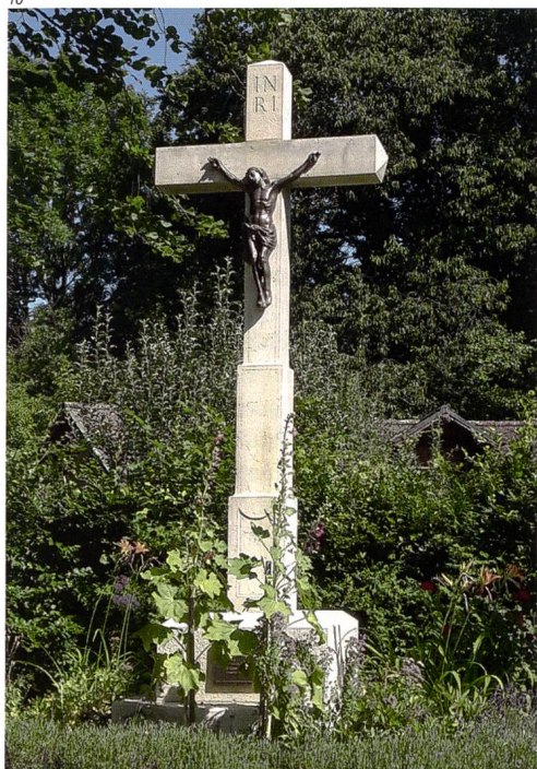
Kant. Denkmalpflege Solothurn.