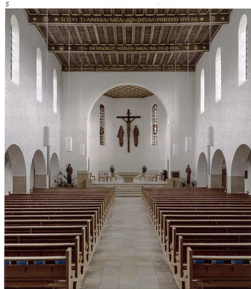
Abb. 6 Derendingen, reformierte Kirche. Ansicht des Turmhelms nach der Sanierung 2015/16. Foto 2017.