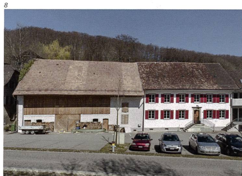
Abb. 9 Lohn-Ammannsegg, Kapelle der Unschuldigen Kinder. Altar nach der Restaurierung 2015. Foto 2017.

eine Brandschutzdecke erstellt worden. Das einfache Sperrholztäfer der 1960er Jahre ist entfernt worden und die Wände zeigen sich heute mit weisser Gipsoberfläche. Die in den Fensternischen zum Vorschein gekommenen Tapetenfragmente aus der Bauzeit wurden erhalten, aber wieder abgedeckt. Da keine Bewirtung externer Gäste mehr vorgesehen ist, sind die Lettern «Gasthof Löwen» von der Fassade entfernt, aber als Reminiszenz an der Wand im Speiseraum aufgehängt worden. Die Bewohner blicken heute durch neue Holzfenster auf die Hauptstrasse des Dorfes. Innen wurden die Rahmenprofile und Sprossen durch Fasen aufeinander abgestimmt, sodass die neuen Fenster in den historischen Mauern weniger wuchtig wirken. Die Aussenmauern des ursprünglichen Gasthofes wurden wieder geweißelt und Sockelbereich und Dachuntersicht im historisch nachweisbaren Grau gestrichen, der Naturstein der historischen Treppe restauriert. Die zuvor zu hellen Fensterläden wurden neu in einem dunklen Rot gefasst, wodurch die Fassade an Kontrast gewinnt. Die hölzernen Elemente der Scheune wie Dachuntersicht, Fensterläden, Tennstor, Türen und vertikale Verschalung wurden materialsichtig restauriert. Die Fassaden von Scheune und ehemaligem Hotel erhielten einen neuen, hellen Grauton, von dem sich nun das historische, in Kalkweiss gestrichene Gasthaus gebührend abhebt.