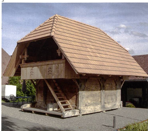
Kant. Denkmalpflege Solothurn.