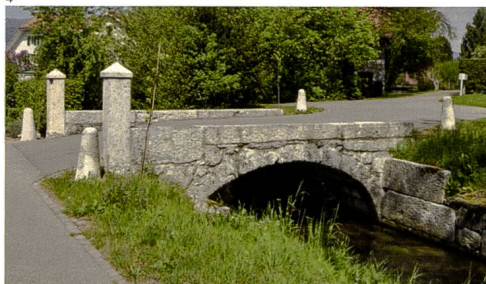
Kant. Denkmalpflege Solothurn.