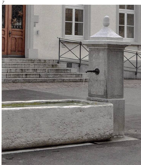
Abb. 7 Erlinsbach. Der neu platzierte und restaurierte Dorfbrunnen. Foto 2016.

Der Dorfbrunnen besteht aus einem grossen Kalksteintrog und einem jüngeren Stock aus Zementstein. Der schlechte Trog ist in zwei Becken unterteilt und war früher mit geschmiedeten Eisenauflegern zum Abstellen der Eimer ausgestattet. Ehemals befand sich der Stock an der Längsseite des Troges. Er wurde wohl um 1900 durch einen Zementstock er-