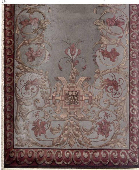
Kant. Denkmalpflege Solothurn.

Das am Fuss des Bühls stehende Wohnhaus wurde 1939 als ehemalige Kaplanei unter kantonalen Schutz gestellt. Sein heutiges Erscheinungsbild verdankt es dem Um- und Neubau von 1917: Damals liess Otto Kuhn, Paris, von den Gebrüdern Belser aus Niedergösgen auf dem Sockelgeschoss des Vorgängerbaus ein historistisches Wohnhaus errichten (Nr. 11). Die Gassenseite zeichnete er mit einem Quergiebel aus, die Westfassade mit einer Eingangsloggia und breitem Erker im Obergeschoss. Ein niedriger Kellerbau unter Flachdach (ehem. Nr. 13) und, zurückversetzt am Hang, das Waschhaus mit Terrasse und kleinem Aufbau unter Satteldach (Nr. 15)