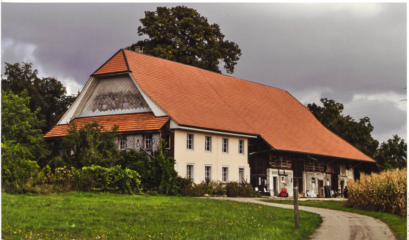
Abb. 1 Biberist, Bromeggstrasse 50, Bromeggghof. Das Viertel- walmdach überspannt den Wohnbau, den Stalltrakt mit drei Durchfahrten und den Gesindewohnteil.

Architektur betont die Qualität der Formen und Materialien, von Jurakalkgewänden, profilierten Eichens turzbalken und mächtigen Sandsteinquadern. Das stattliche Viertelwalmdach überspannt den Wohnbau mit zwei grossen Gewölbekellern und einen Stalltrakt mit drei Durchfahrten. Westlich ist dem Wohngebäude eine mit Schieferschindeln verschaltete, befensterte Laube angebaut. Östlich wurde dem