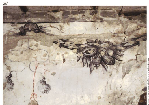
Abb. 28 Schlösschen Vigier, Subingen. Dem Solothurner Maler Michael Vogelsang zugeschriebene Grisaille-Malereien, um 1680. Foto 2017.