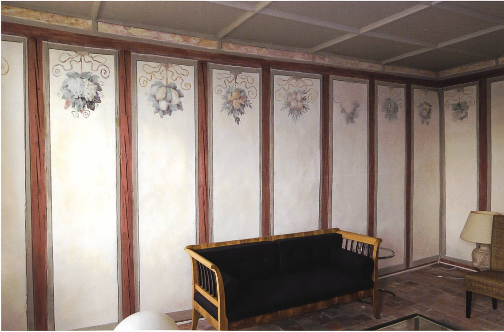
Abb. 23 Baselstrasse 22, Solothurn. Josefshof. Bei Umbauarbeiten entdeckte und restaurierte Wandmalerei, um 1646. Foto 2018.