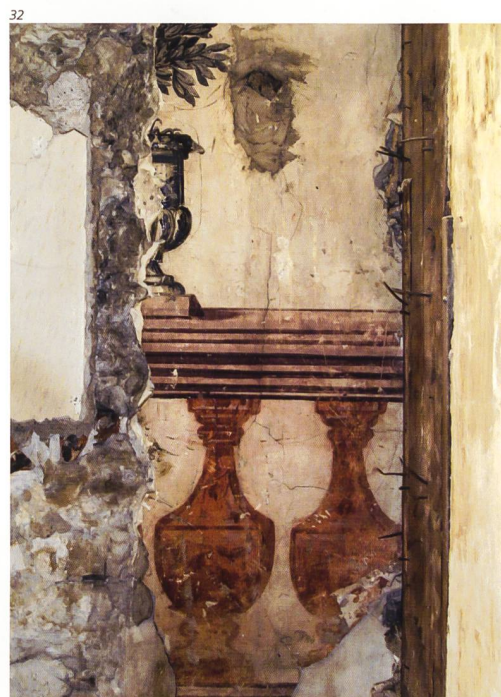
Abb. 32 Kreuzackerquai 2, Solothurn. Gressly-Haus. Beim Umbau 2012 kamen fragmentarisch erhaltene Baluster- und Vasenmalereien von 1697 zum Vorschein. Foto 2012.