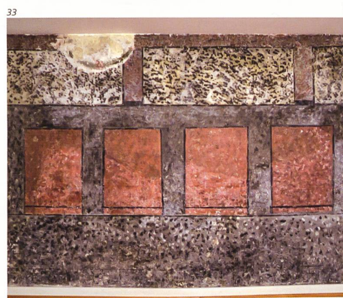
Abb. 33 Gurzelgasse 25, Solothurn. Hinterhaus. Bei der Gesamt-sanierung des Hinterhauses entdeckte und restaurierte Wandmalereien, um 1700. Es befinden sich darunter noch drei ältere Malereifassungen. Foto 2018.

«Fürniss aber auff ein ander gattung. Nimm Glorie / das ist Terpentin / ein Pfundt / und zweymal also vil Leinöl / lass das Heiss werden / und schaume es wol / rür darnach des Mastix und gbrannten Beins dar-eyn / wie obsteht / so hasst du auch guten Fürniss.» 31