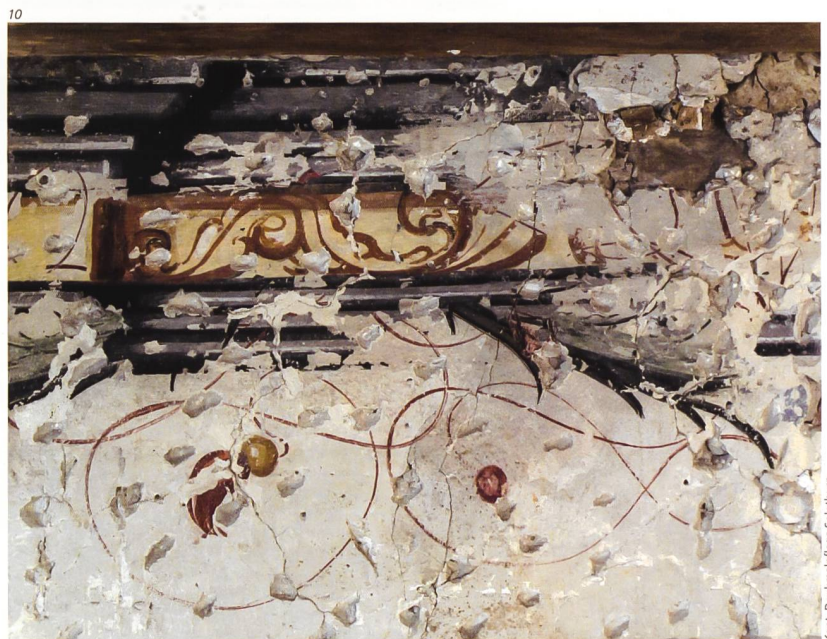
Kant. Denkmalpflege Solothurn.