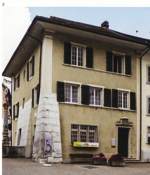
Abb. 4 Hauptgasse 54, Solothurn. Bauuntersuchung nach dem Brand von 2011, Zustand nach den Demontagearbeiten. Gebäudeaufstockungen und Wandmalereien von 1686 konnten dabei nachgewiesen werden. Foto 2011.