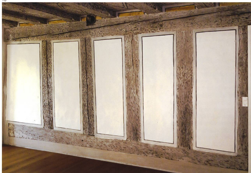
Flury & Rudolf Architekten, Solothurn.