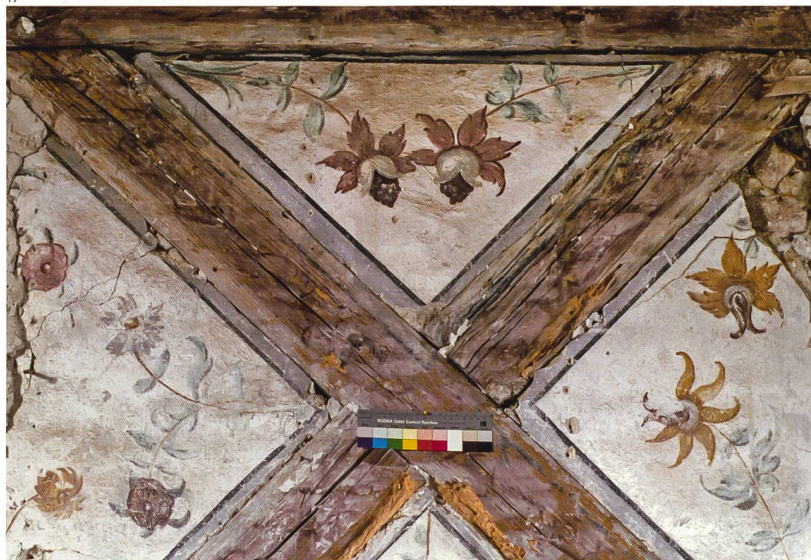
Kant. Denkmalpflege Solothurn.