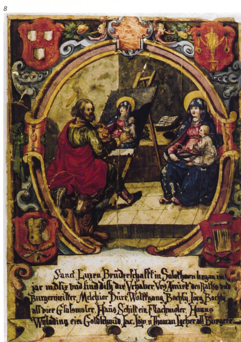
Abb. 8 Titelbild des Wappenbuchs der 1559 gegründeten St. Lukasbruderschaft. Es zeigt den heiligen Lukas als Maler, wie er die heilige Mutter mit Kind malt. Im Text sind die Gründungsmitglieder angegeben (aus: Zentralbibliothek Solothurn, Wappenbuch, Band I).