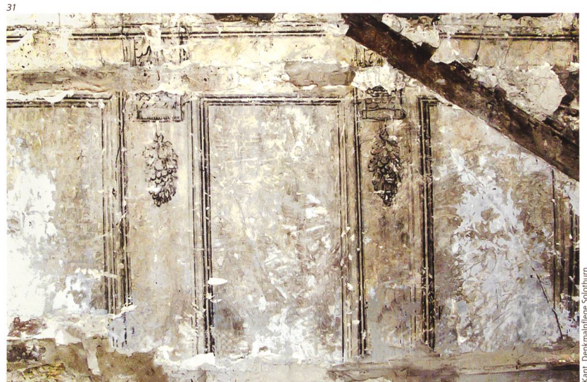
Abb. 31 Hauptgasse 54, Solothurn. Bei der Bauuntersuchung nach dem Brand 2011 gefundene, fragmentarisch erhaltene Grisaille-Malerei von 1686. Foto 2011.

Auch waren viele Maler- und Rezeptbücher aus anderen Gegenden und aus dem Ausland im Umlauf und wurden sicher zum Teil auch in Solothurn rege benutzt. Daraus ein Beispiel eines Rezeptes für einen Firnis aus einem Buch aus Deutschland von 1562: