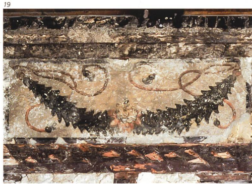
wvb Architekten, Solothurn.

Abb. 22 Hauptgasse 69, Solothurn. Von-Roll-Haus. Bei Sondie- rungsarbeiten partiell freige- legte Fensterleibungsmalerei von 1618. Sie liegt unter einer nachträglichen Grisaille-Male- rei von 1650. Foto 2015.