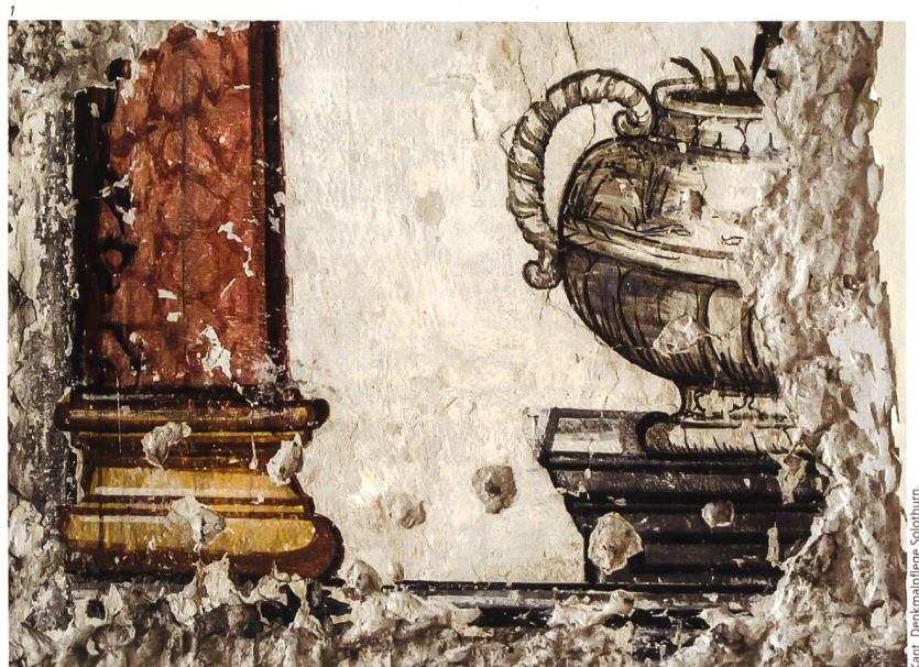
Abb. 1 Hauptgasse 81, Solothurn. Ehemaliges Chorherrenhaus. Typisches Beispiel eines bei einem Bauuntersuch gefun- denen Fragments einer Trom- pe-l'Œil-Malerei von 1690. Es besticht durch seine leuchtende originale Farbigkeit. Foto 2011.

Ein wichtiger Grund für den damaligen wirtschaftlichen Aufschwung der Stadt lag sicher auch in der von 1530 an bis zur Französischen Revolution 1798 währenden ständigen Niederlassung des Gesandten des französischen Königs, des Ambassadors. Die französische Lebensart war dadurch im Solothurner Patriziat sehr verbreitet, was sich natürlich auch im Bauen und Ausstatten von Häusern auswirkte. Zudem wurden zahlreiche Patrizierfamilien durch Handel und fremde Kriegsdienste, auch während der Zeit des rund um die Eidgenossenschaft wütenden Dreissigjährigen Krieges (1618–1648), sehr reich, und sie investierten einen grossen Teil ihres Vermögens in den Bau von repräsentativen Stadt- und Sommerhäusern. Dies schlug sich auch im Verdienst vieler Handwerker nieder, die ihrerseits ebenfalls ihre Häuser um- und ausbauen konnten. Neben kompletten Auskernungen, neuen Balkenlagen, Dachstühlen und Geschossaufstockungen (Abb. 4)