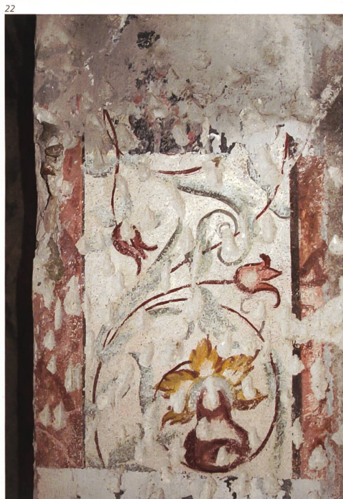
Kant. Denkmalpflege Solothurn.