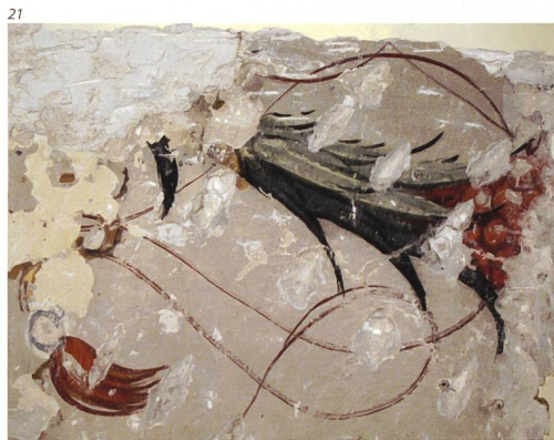
Kant. Denkmalpflege Solothurn.

Die meisten der Dekorationsmalereien wurden in Kalkfarben- und Secocotechnik ausgeführt, da viele Wände nicht neu verputzt wurden und die Maler die alten Untergründe übernehmen mussten. Bei heutigen Freilegungen und Restaurierungen kann dies zum Teil zu Problemen mit der Haftung der Malschicht auf den älteren darunterliegenden Schichten führen, da sich die Malschicht nicht mit dem trockenen alten Untergrund verbinden konnte. Vielfach