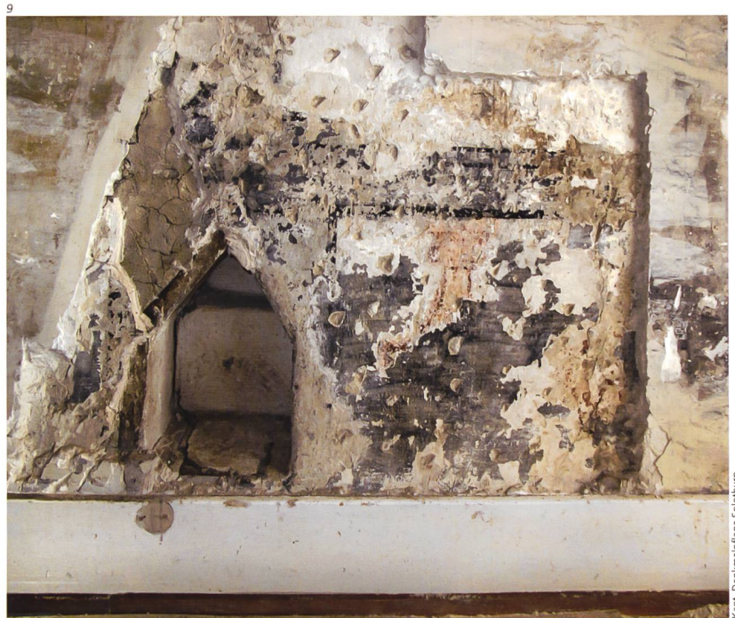
Kant. Denkmalpflege Solothurn.

Ältere Dekorationsmalereien aus dem Mittelalter findet man in Solothurn in Privathäusern dagegen eher selten. Einzelne graue Umrandungsmalereien oder bemalte Wandsockelbereiche mit aufgemalten weissen Fugenstrichen kommen aber vor. Erst ab dem 16. Jahrhundert und schwerpunktmässig im 17. bis Anfang des 18. Jahrhunderts erhielten die Räume dekorative und oft mehrfarbig gemalte Wandgestaltungen. Im 18. Jahrhundert wurden diese meistens durch grau gefasste Wandtäfer mit teilweise vergoldeten Profilen und hellem Stuck und Gips verdrängt. Erst der Historismus des 19. und der Jugendstil des 20. Jahrhunderts brachten wiederum farbige Dekorationen in die Wohnungen und Treppenhäuser. 26