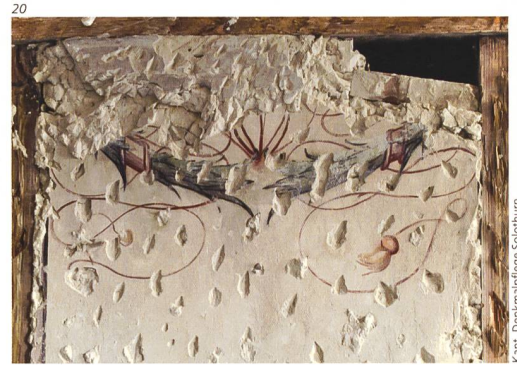
Kant. Denkmalpflege Solothurn.

Alte Techniken und Materialien können vielfach bereits optisch durch Beobachtungen erkannt werden. Zusätzliche genauere Angaben über Material, Technik und Fassung geben Farbsondierungen, Dünn- schliffe, Pigment- und Bindemittelanalysen. Beim Mörtel kann durch Erstellen einer Siebkurve die Zusammensetzung eruiert werden.