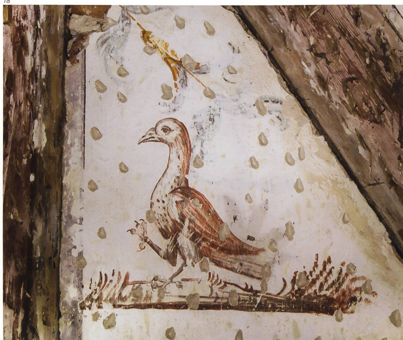
Kant. Denkmalpflege Solothurn.