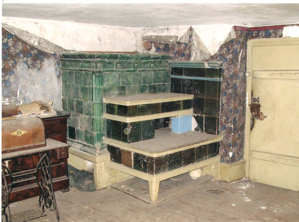
Abb. 1 Metzerlen, Burgstrasse 2. Der Kachelofen mit der Kunst steht im hinteren Anbau des Hauses. Der Kunstofen mit den schablonierten Kacheln stammt aus der ersten Hälfte des 19. Jahrhunderts.

In der Stube an der nördlichen Aussenmauer und neben der Küche steht ein rechteckiger Kastenofen mit grün glasiertem Reliefdekor; davor und daran angebaut ist ein zweistufiger Kunstofen aus dem 19. Jahrhundert. Aufmerksamkeit zieht vor allem der Kastenofen auf sich, doch weiss man nicht, woher seine Kacheln stammen und wann er hier aufgesetzt wurde. Der Fries des Ofens besteht aus zwei sich abwechselnden Kacheltypen, beide ausgestattet mit einem Groteskendekor mit Masken oder Maskaronen. Groteske Ornamente gehören zum Fundus