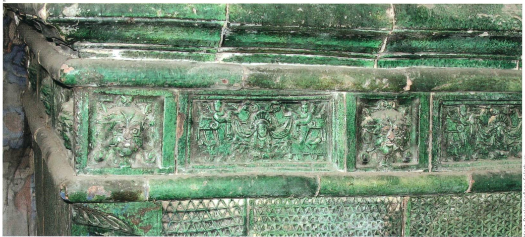
Abb. 2 und 3 Die Ofenkacheln im Stil der Spätrenaissance stammen aus der Zeit zwischen 1550 und 1650. Der Fries besteht aus zwei Kacheltypen mit Grotteskenmasken. Die Füllkacheln zeigen ein Relief mit Wabenmuster. Die Eckkacheln enden oben und unten in einer Muschel.