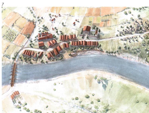
Zeichnung: Kantonsarchäologie Solothurn, Monika Krucker.