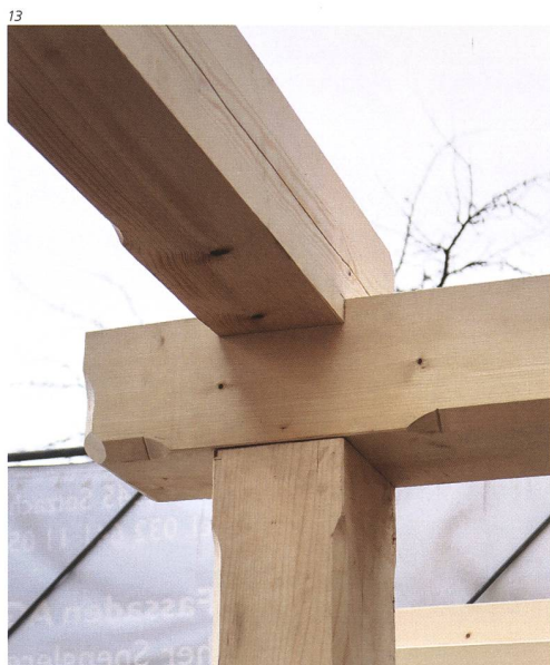
Kant. Denkmalpflege Solothurn.