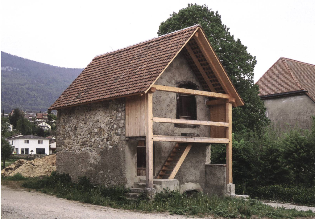
Abb. 1 Selzach, Speicher Bellacherstrasse 1b, nach der Restaurierung 2019. Die Laube wurde rekonstruiert und das Dach wiederhergestellt. Das Fassadenmauerwerk mit seinen älteren Verputzflicken konnte grösstenteils belassen werden. Der eingestürzte ostseitige Anbau wurde ersatzlos abgerissen.