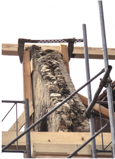
Kant. Denkmalpflege Solothurn.