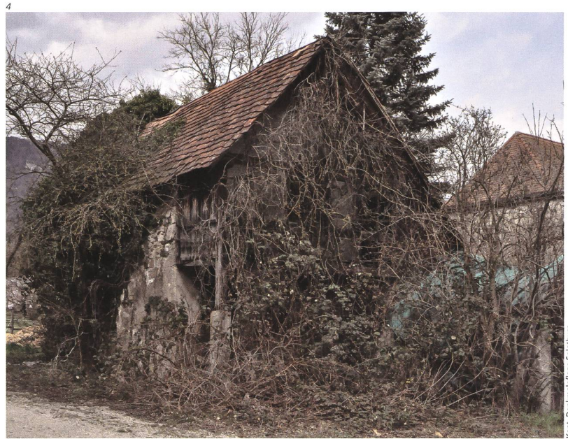
Kant. Denkmalpflege Solothurn.

im Lauf der Jahrhunderte, vor allem im 19./20. Jahrhundert, viele Steinspeicher abgebrochen oder ihrem Schicksal überlassen wurden. Umso mehr sollte zu den letzten erhaltenen Exemplaren im Kanton Sorge getragen werden.