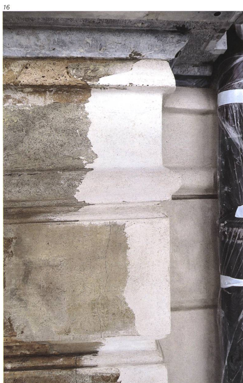
Abb. 16 und 17 Nordfassade während der Restaurierung. Neue Auf- mörtelungen von Profilen, Eckkanten und Oberflächen mit einem weichen Kalk- mörtel.