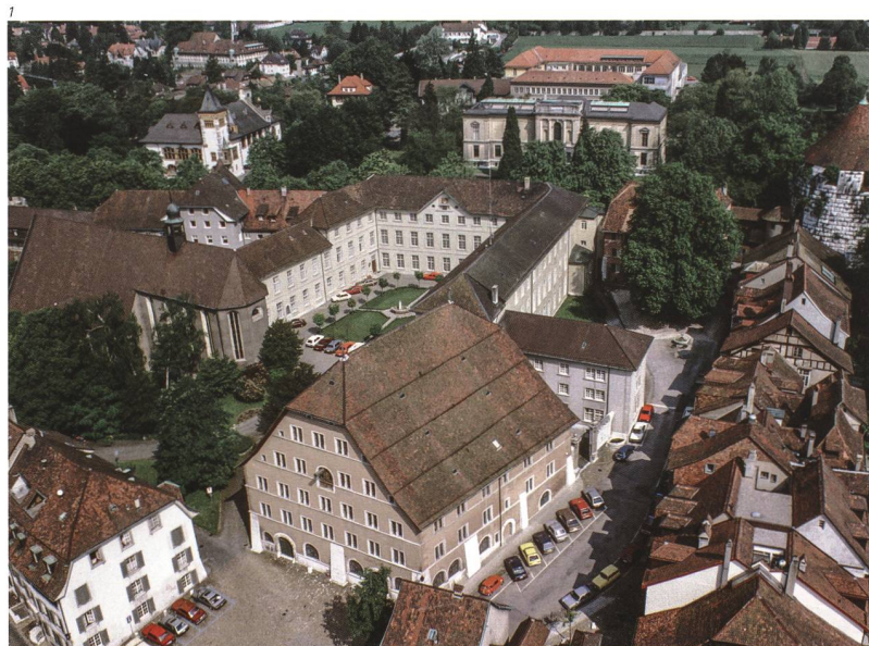
Abb. 1 Blick vom Turm der St.-Ursen-Kathedrale aus auf die U-förmige Anlage des Ambassadorshofs, Foto 1983. Im Vordergrund liegt der mächtige Baukörper des Alten Zeughauses. Links schliesst die Franziskanerkirche an den Ambassadorshof an. Nordseitig liegt der Stadtpark mit Kunstmuseum und Konzertsaal.

ausgebrochenen Revolution verliess der französische Gesandte 1792 Solothurn. Beim Einmarsch der Franzosen 1798 übernahmen diese den leerstehenden Ambassadorshof und nutzen ihn als Kaserne; als solche diente die Anlage bis 1874. 1882 erfolgte der umfassende Umbau des mehrheitlich leerstehenden Hofes zur Kantonsschule. Dabei wurde das Innere des Gebäudes nach einem Projekt des Architekten Ernst Glutz-Blotzheim umfassend verändert und dem neuen schulischen Betrieb angepasst, sodass von der einstigen Pracht der Ausstattungen praktisch nichts mehr übrig blieb. Die neue Nutzung als Schule verlangte auch eine Belichtung von Norden. Die nordseitig bis anhin durchlaufende, mehrheitlich fensterlose mittelalterliche Stadtmauer musste daher einer neuen befensterten, neoklassizistischen Nordfassade weichen. Nach dem Auszug der Kantonsschule wurde die Anlage 1958 für die kantonale Verwaltung umgebaut. Dabei wurde ein zusätzlicher Südostflügel neu hinzugefügt.