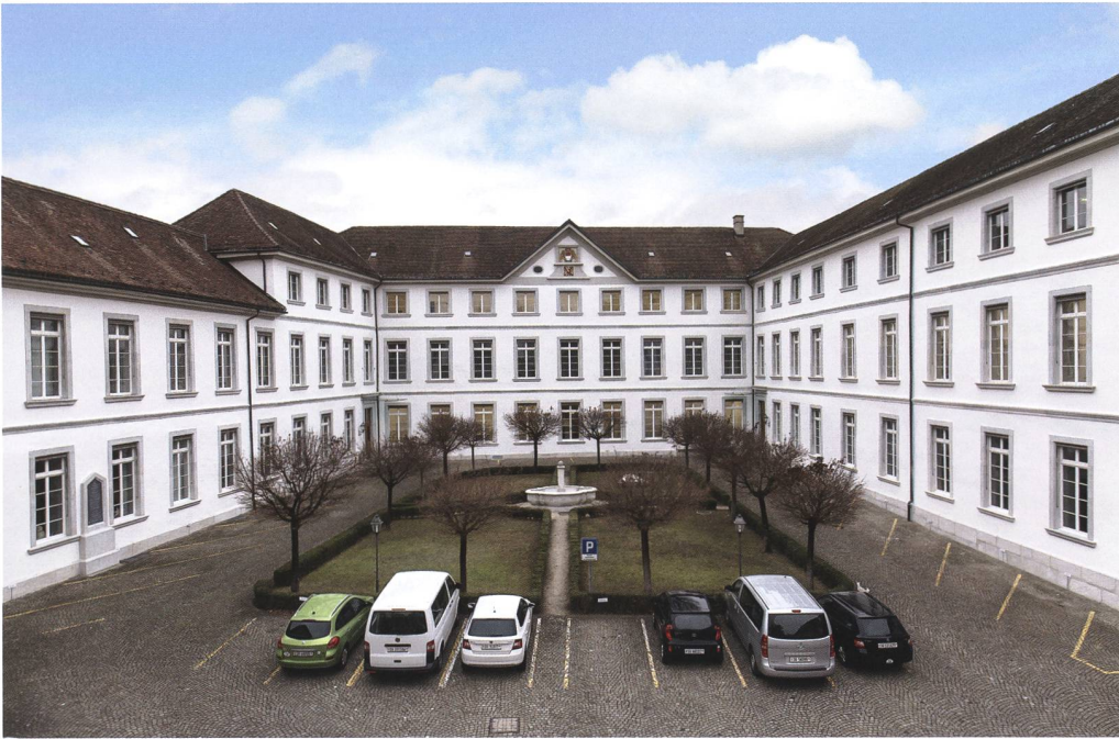
Abb. 2 Blick von Süden auf die barocke Dreiflügelanlage von 1725, im Zustand nach der Fassadenrestaurierung von 2018. Durch die neue weisse Farbgebung erhielt die Fassadengliederung wieder ihre Kraft zurück.