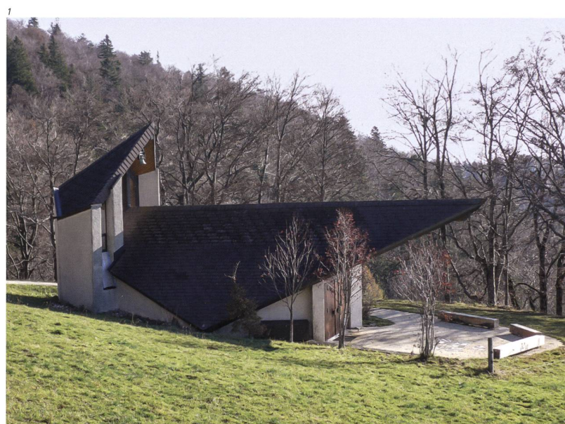
Abb. 1 Oberdorf, ökumenische Bergkapelle Weissenstein. Die 1981 erbaute Kapelle ist das jüngste und auch aktuellste Schutzobjekt im Kanton Solothurn.

Vertreten sind Kulturdenkmäler aus allen Epochen: aus der Römerzeit die Castrumsmauern in Olten und Solothurn, aus dem Mittelalter der Turm in Halten, aus der Renaissance das Rathaus Solothurn, aus dem Barock die Wallfahrtskirche Oberdorf, aus dem Klassizismus die Fassade der Klosterkirche Mariastein, aus dem Historismus der Konzertsaal in Solothurn, aus dem Heimatstil die reformierte Thomaskirche Biberist, aus der klassischen Moderne das Touring in Solothurn und aus der Nachkriegsmoderne die Klemenzkirche in Bettlach – um lediglich jeweils ein Objekt pro Epoche zu erwähnen. Das jüngste und auch aktuellste Schutzobjekt ist im Übrigen die 1981 erbaute Bergkapelle auf dem Weissenstein (Abb. 1). Neben den genannten traditionellen Gebäudetypen, die auch andernorts in der Schweiz in der jeweiligen regionalen Ausprägung vorkommen, besitzt der Kanton Solothurn auch sehr spezielle, ja einzigartige Schutzobjekte. Zu nennen sind diesbezüglich das Goetheanum und seine Nebenbauten in Dornach, der Dieselmotor von 1911 in Luterbach, die Autobahnraststätte Deitingen-Süd oder ein als Holzhaus getarnter Bunker aus der Zeit des Zweiten Weltkriegs in Hauenstein-Ifenthal (Abb. 2, 3).