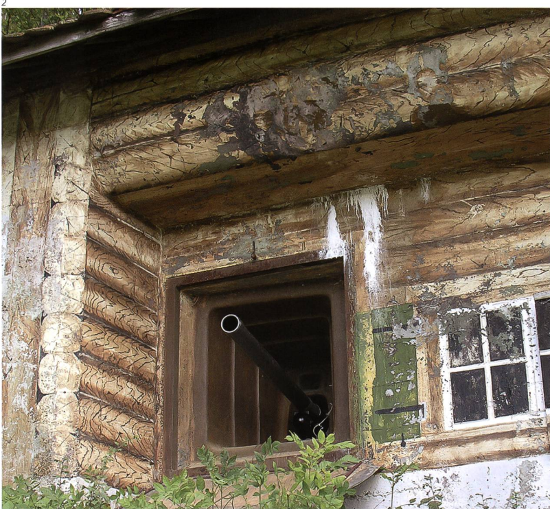
Kant. Denkmalpflege Solothurn.

Die archäologischen Funde und Fundstellen im Kanton Solothurn sind sehr vielfältig und verteilen sich auf alle Epochen der Menschheitsgeschichte. Die ältesten menschlichen Zeugnisse aus dem Kanton