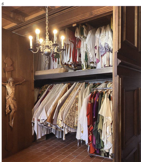
Angela Kummer, KGS Solothurn.

Zur Einführung wurde dem Kulturgüterschutz auch aufgezeigt, wer für den Erhalt des mobilen Kulturguts zuständig ist: Der 2020 verstorbene Pater Bonifaz hielt jahrelang unermüdlich fest, welche Gegen-