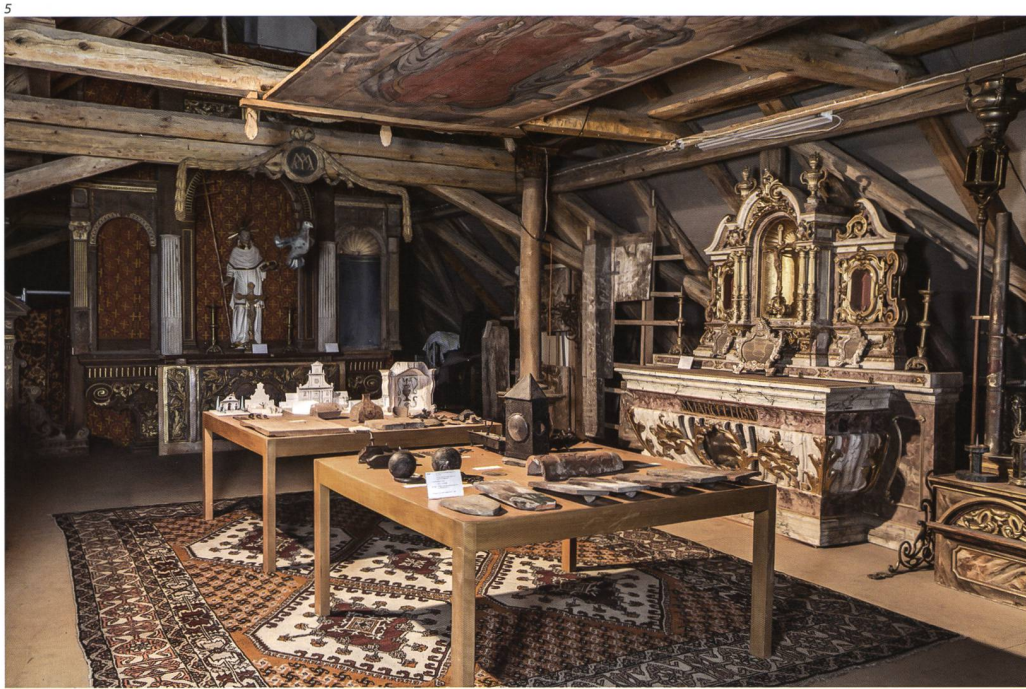
Abb. 5 Der südliche Teil des «Museums im Glutzbau».