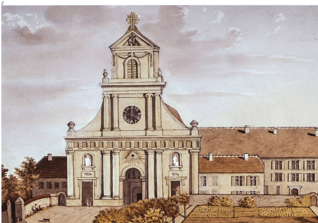
Abb. 2 Westansicht der Klosterkirche. Vedute von David Schmid, um 1850, Stiftsarchiv Einsiedeln. Die Vedute zeigt die Kirche mit ihrer ursprünglichen Farbfas- sung, die die roten Sandstein- elemente überdeckte.