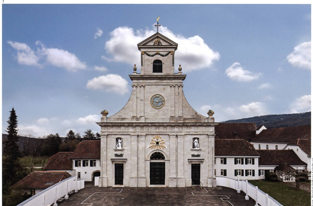
Abb. 1 Metzerlen-Mariastein, Klosterkirche, Klosterplatz 1. Ansicht der Westfassade nach der Restaurierung 2020.

Die Fassade ist grösstenteils aus gelblichem Jurakalkstein gebaut. Ausnahmen bilden die bildhauerisch anspruchsvollen Schmuckelemente, die aus dem besser zu bearbeitenden roten Sandstein, der aus dem Raum Basel stammte, gefertigt sind. Dazu gehören insbesondere das Auge Gottes über dem Mittelportal, die mit Blumen und Früchten gefüllten Vasen über dem Erdgeschossgebälk, die ionischen Kapitelle im Obergeschoss, die darüberstehenden Flammenurnen, die Festons im Glockengeschoss sowie das Wappen des Abtes Placidus im Dreiecksgiebel. Die beiden weiss gefassten allegorischen Nischenfiguren über den Seitenportalen bestehen aus Kalkstein.