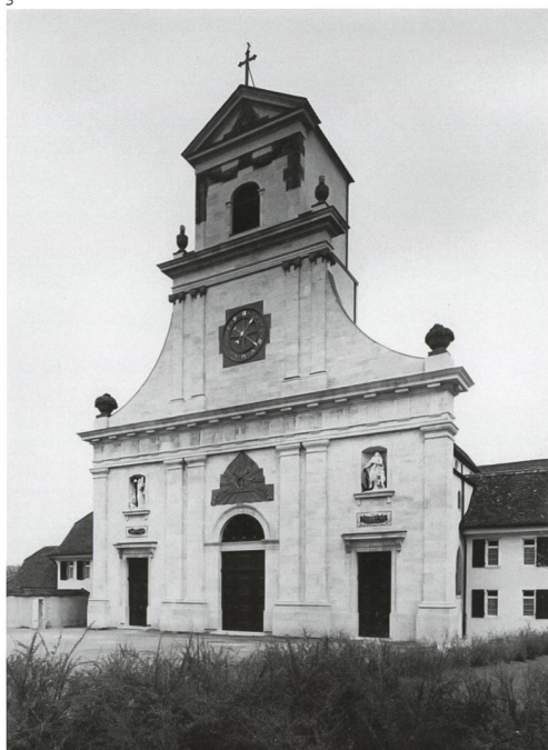
Arnold Faiss, Solothurn.

Aufgrund dieser Untersuchungsergebnisse entschieden sich die Bauherrschaft und die Denkmalpflege damals für ein neues Farbkonzept. Es sah vor, auf einen kompletten Fassadenanstrich im Sinne des ursprünglichen Zustands zu verzichten, lediglich die roten Sandsteinelemente im Farbton des Kalksteins zu fassen und diese somit besser in das Gesamtbild zu integrieren. Weiter wurde beschlossen, den plastischen Schmuckelementen eine neue polychrome Fassung zu geben. Dabei stützte man sich einerseits auf die vorgefundenen Farbtöne, andererseits wählte man weitere Farbtöne aufgrund von Vergleichen mit ähnlichen Bauten aus derselben Zeitepoche. Es