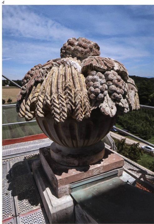
Abb. 4–7 Details der Fassade vor der Restaurierung 2020. Farbabplatzungen, Farb- degradation und Schäden am Sandstein.