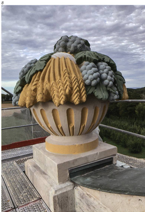
Phoenix Restauro, Biel.