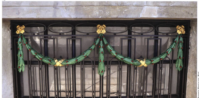
Phoenix Restauro, Biel.