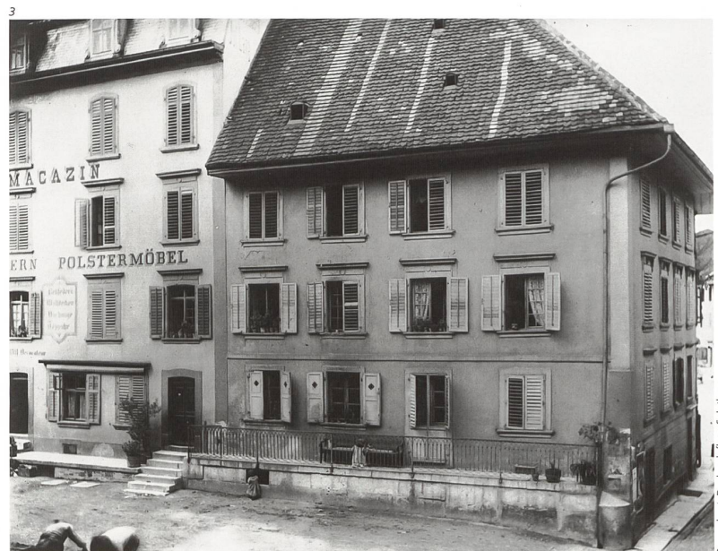
Abb. 3 Ehem. Gasthaus zum Turm, um 1900. Links das Möbelhaus Lang.

Abb. 2 Olten. Liegenschaft Hauptgasse 33 / Oberer Graben 4. Ansicht nach der Ausserrestaurierung 2020/2021.