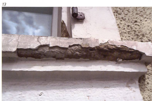
Kant. Denkmalpflege Solothurn.