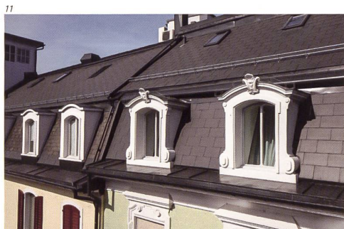
Simon von Gunten, Solothurn.

Rundecken in den Glasscheiben kam am Kopfbau zur Anwendung. Auch beim Mittelhaus erhielten die neuen Fenster jeweils einen Kämpfer, sie sind insgesamt aber in den Detailformen etwas einfacher gestaltet. Und das Haus Oberer Graben 4 zeigt eine einfache klassische Dreiteilung der Fensterflügel mit jeweils zwei Quersprossen. Für alle drei Hausteile wurden nach denkmalpflegerischen Vorgaben Holzfenster mit Zweifach-Isolierverglasung eingebaut. Die Sprossen sind aussen und innen rahmenbündig fix montiert, und zwischen den Gläsern ist ein Steg eingebaut: also Fenster im sogenannten Landhaus-sprossen-System. Dazu kamen wichtige Details wie Schlagleisten, Holzabdeckungen über den Metallwitterschenkeln und Profilierungen an Rahmen, Kämpfern und Sprossen nach Angaben der Denkmalpflege.