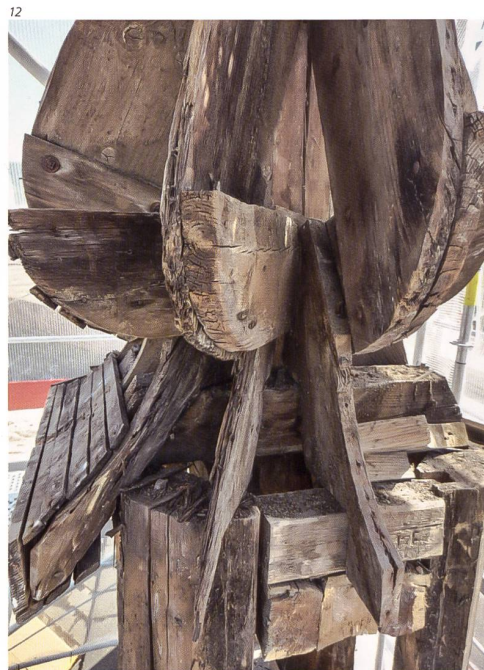
Kant. Denkmalpflege Solothurn.