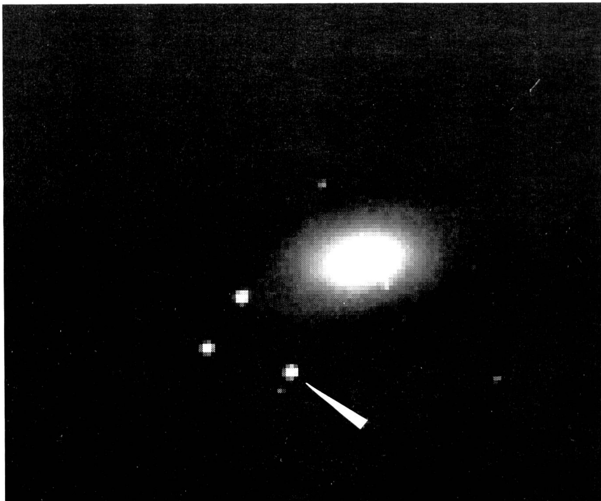
Abb. 1: CCD-Aufnahme der Supernova 1993J (Pfeil) in M81. Die Breite des Bildes beträgt 11'. Mit SBIG ST-4 am 12. 4. 1993, 22.19 Uhr MESZ, 240 s Integrationszeit, Meade MTS-SN8, f = 800 \text{ mm}, f/4.

dene Beobachtungen bestätigten die Präsenz des neuen, stellaren Objektes 3' südwestlich vom Kern der Galaxie. Abbildung 1 zeigt den Neu-