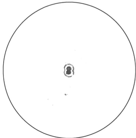
Abb. 4: ξ Ursae Majoris im 15-cm-f/8-Newton bei 435x (22./23. Januar 1994). Norden oben, Osten links.

Alula Australis sollte nur in einer wirklich ruhigen Nacht, in welcher der Mond oder die Planeten