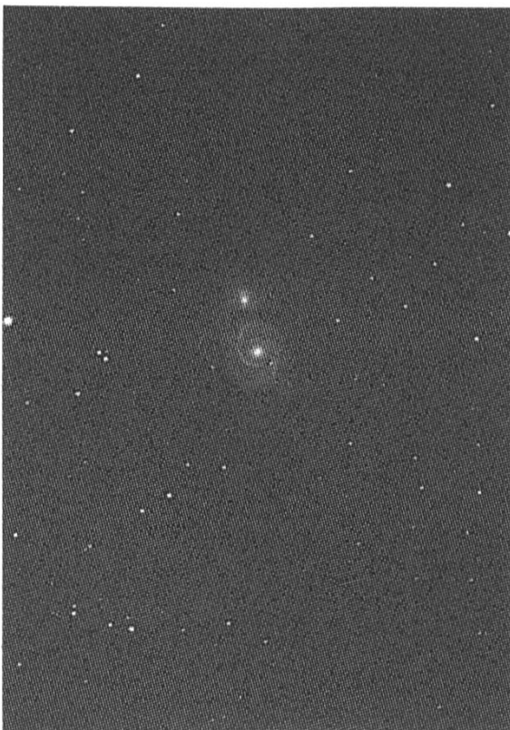
Abb. 3: M 51 / NGC 5195, fotografiert durch 20-cm-f/4-Schmidt-Newton am 25. 4. 1992, 15 min auf Fujicolor HG400.