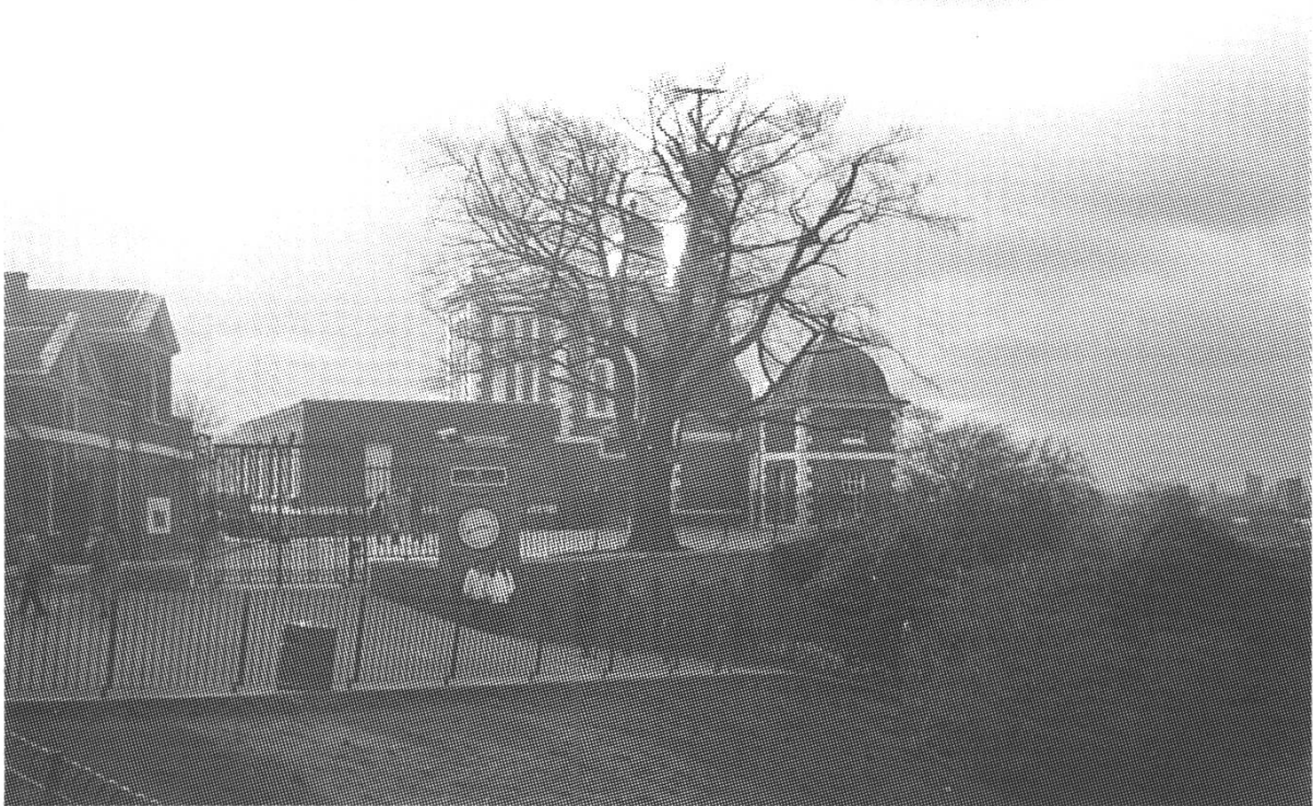
Abb. 2: Das Old Royal Observatory in Greenwich. Links davon befindet sich die Kuppel (nicht sichtbar).

dass ich mich auf der östlichen befinde. Denn im Innern des Old Royal, sowie draussen auf der «Terrasse» erblicke ich den Metallstreifen der den künstlichen Meridian darstellt. Täglich punkt 13:00 Uhr saust von einem Mast auf dem Ostturm der Zeitballon herab. Dieser setzt den Ausgangspunkt für den Metallstreifen, mit dem die Trennungslinie zwischen der westlichen und der östlichen Hemisphäre gekennzeichnet wird. 1884 wurde in Greenwich der Meridian (Längengrad Null) als Hauptmeridian der Welt ausgewählt. Und das macht diesen Ort auch so populär. Denn wer sich, nachdem er zuerst einmal rund £3.50 Eintrittsgeld hinblättert, Zutritt verschafft hat, kann mit einem Fuss im