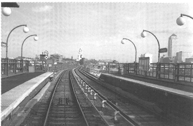
Abb. 1: Dockland Light Railway.

Der Sternwarte nähernd frage ich mich, ob ich nun auf der westlichen oder östlichen Hemisphäre stehe bzw. gehe. Sowie ich vor dem Eingang stehe, kann ich feststellen,