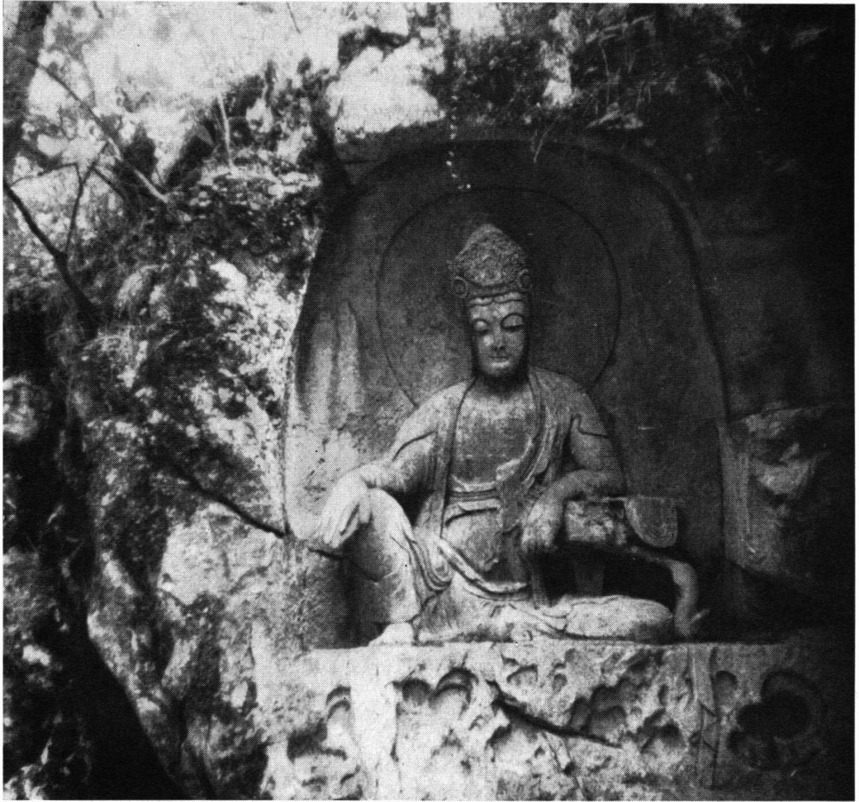
Fig. 1. Epoque Song, Fei-lai-fong, Hangtcheou (Chekiang)