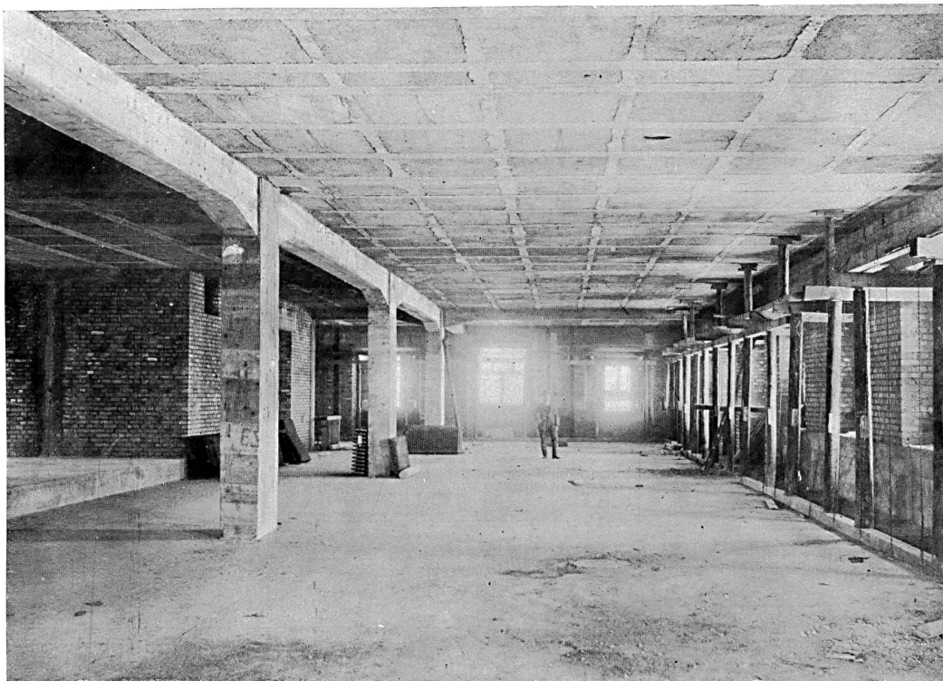
Vue d'en bas d'un plafond non lissé, de 8 m d'écartement.

Au dire des ingénieurs, la construction de toits à traverses étendues présente un certain intérêt, en ce sens que le calcul et la configuration de la construction doivent représenter un écartement de 18 m.