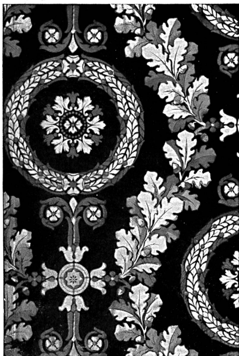
« Tekko »