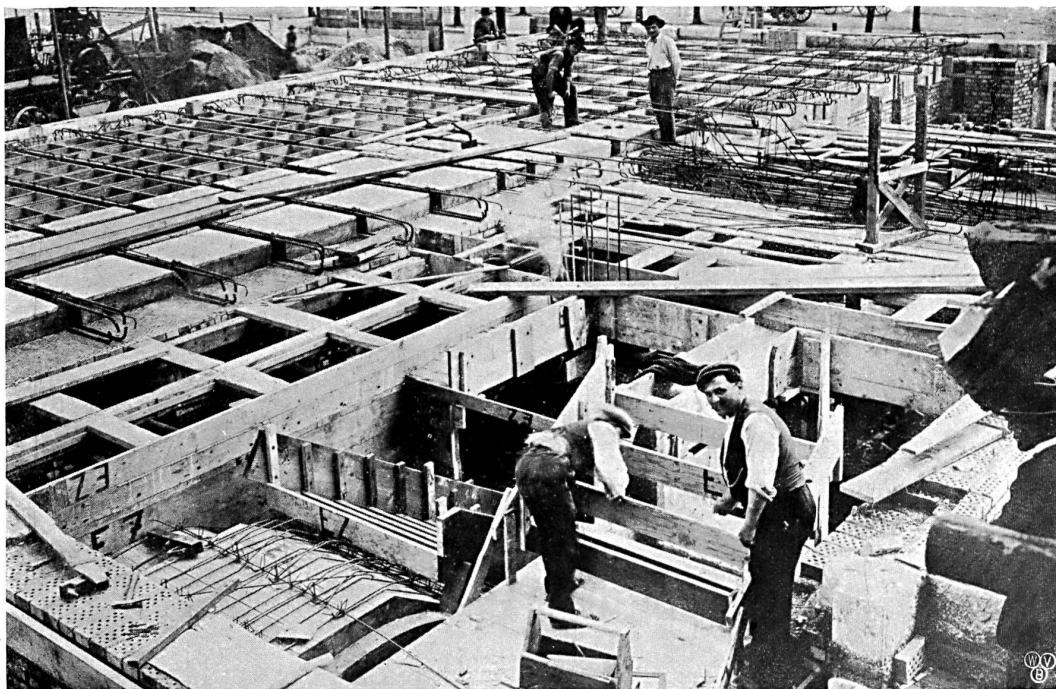
La couverture en béton; le remplissage des corps creux.

En effet, les architectes s'efforcent de trouver la meilleure construction de remplacement, fournie par le béton armé. Sur la proposition des entrepreneurs, on choisit la couverture des corps creux, système Züblin. Cette couverture, en ce qui concerne la