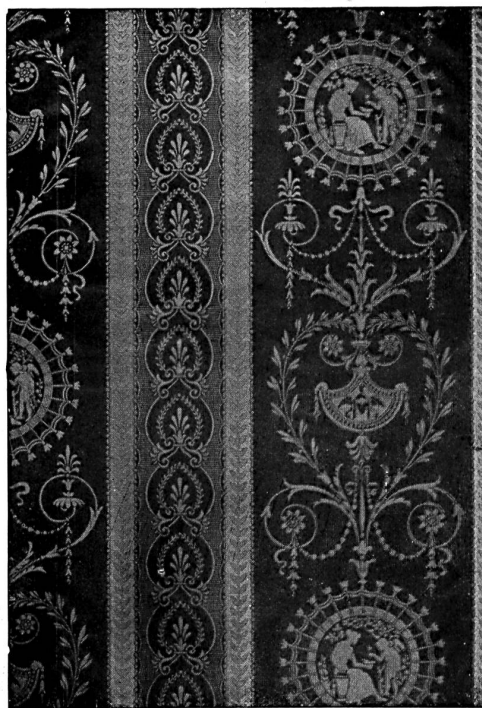
« Salubra »

Les moments du système statique indéfini ont la forme M = M - H \cdot y + H' \cdot y' et peuvent être déterminés simplement à l'aide du compas, les moments M du portant statique indéfini et les produits H \cdot y et H' \cdot y' étant constants. De la même façon, on procédera au calcul des autres brides du toit. La justesse du calcul devra prouver, après la mise au net du travail, son superbe maintien.