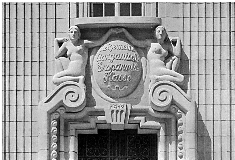
Porte d'entrée de la Caisse d'Épargne argovienne à Aarau. Sculptures de Kappeler, Zurich.

Les articles et les planches ne peuvent être reproduits qu'avec l'autorisation de l'éditeur.