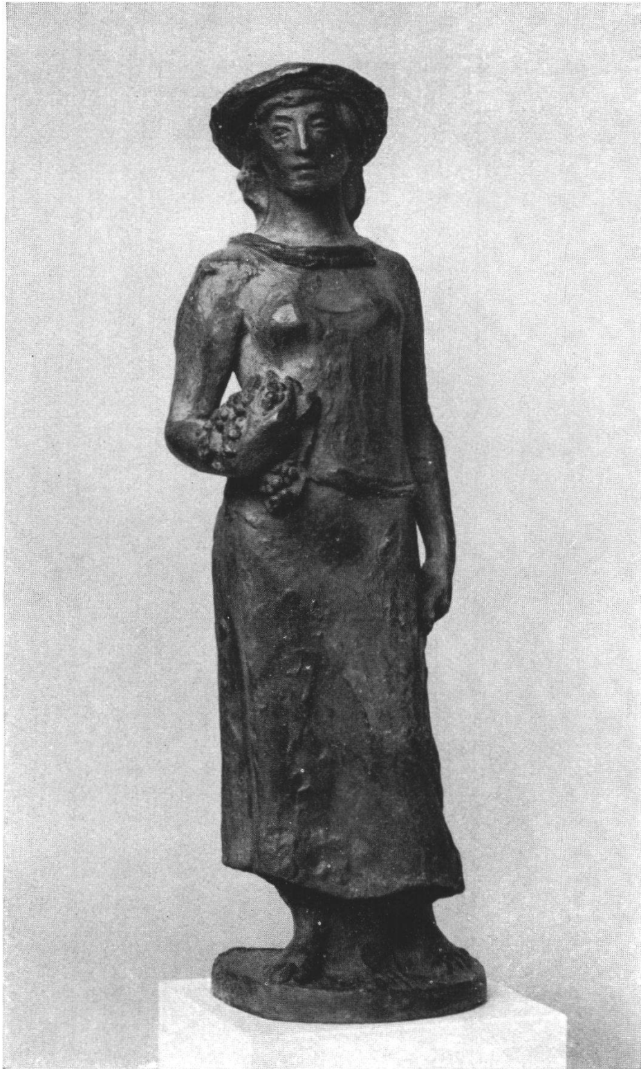
E. Spörri: Winzerin.