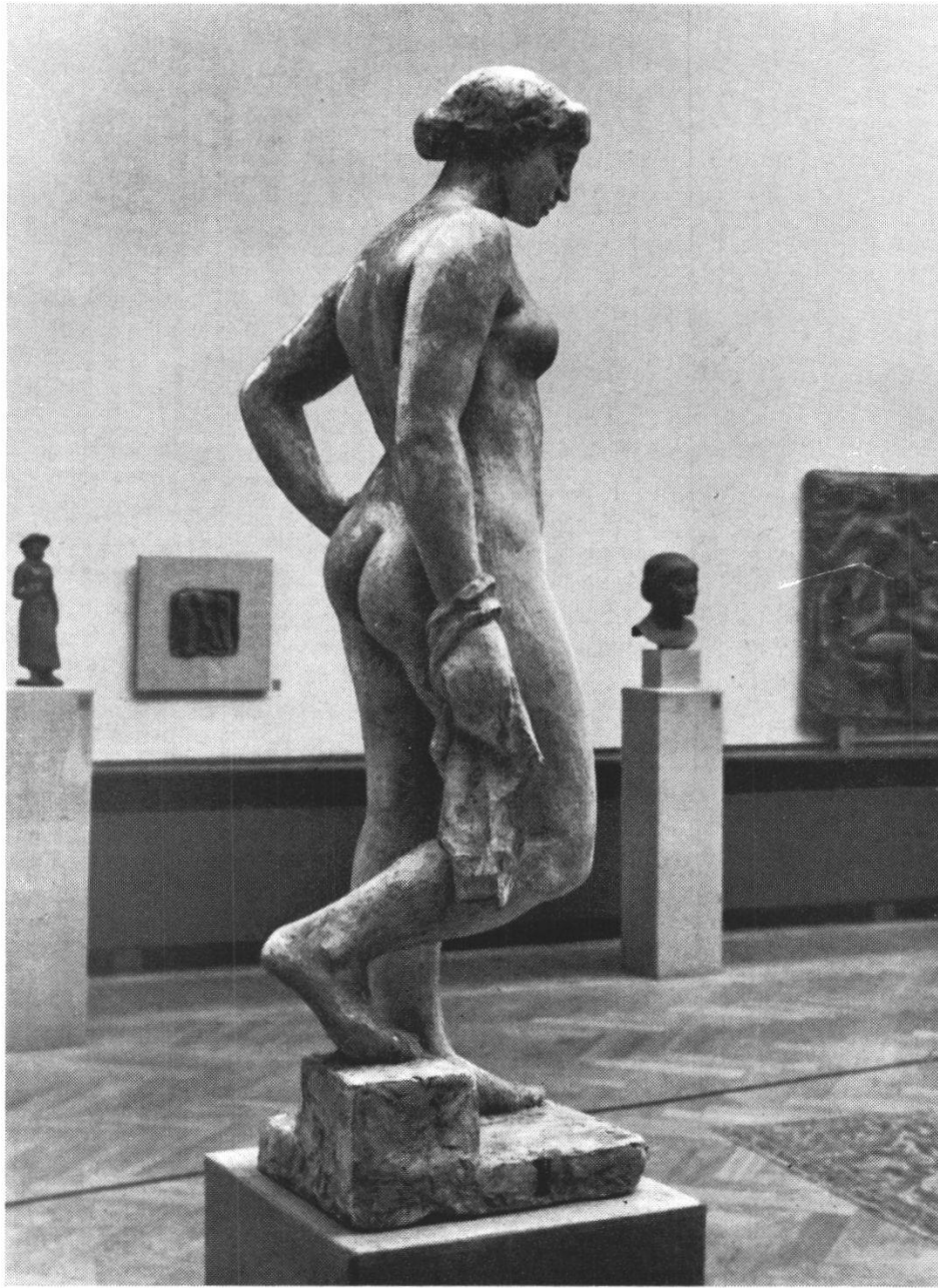
E. Spörri: Stehende Badende.