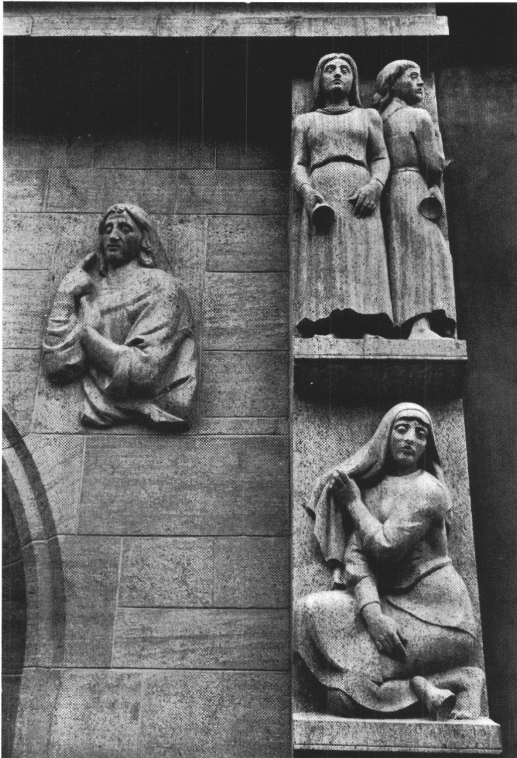
E. Spörri: Portal der Stadtkirche in Aarau. Details: Johannes und Törichte Jungfrauen.