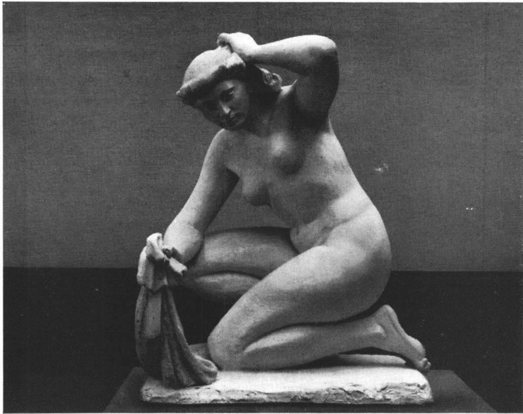
E. Spörri: Kauernde Badende.