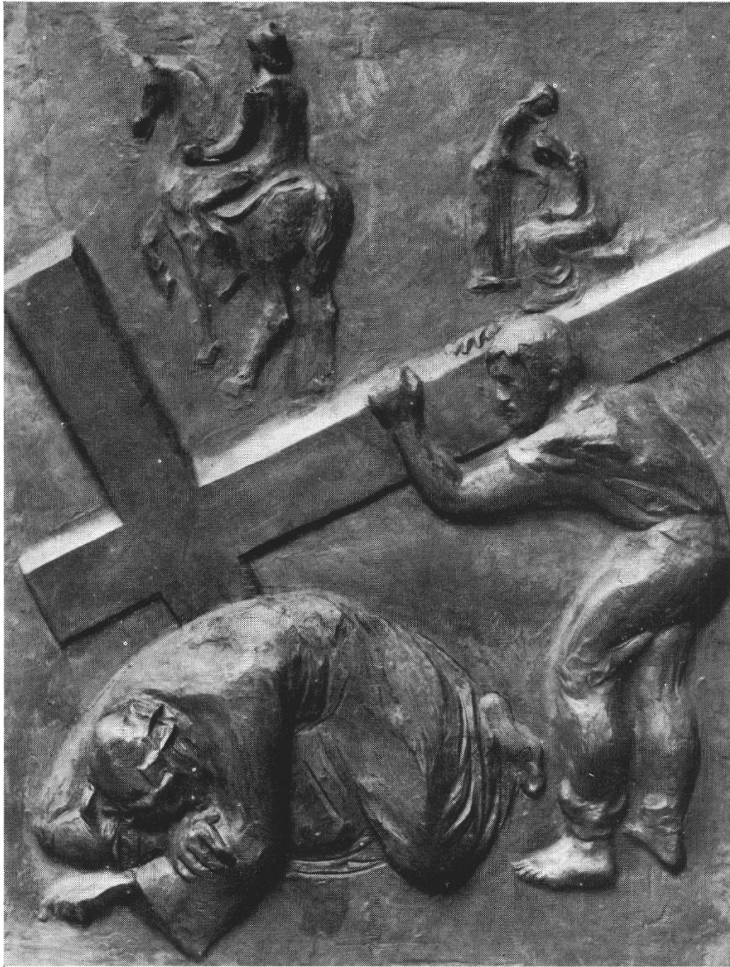
E. Spörri: Relief aus dem Kreuzweg von Muri (Bronze)