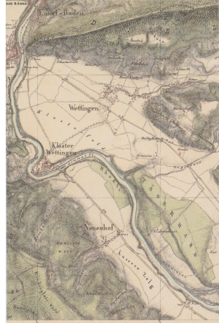
Tafel 2: Ansicht aus der Michaeliskarte (1837-42) und der Siegfriedkarte (1851, 1954, 1914, 1931, von links nach rechts), 1:25.000.