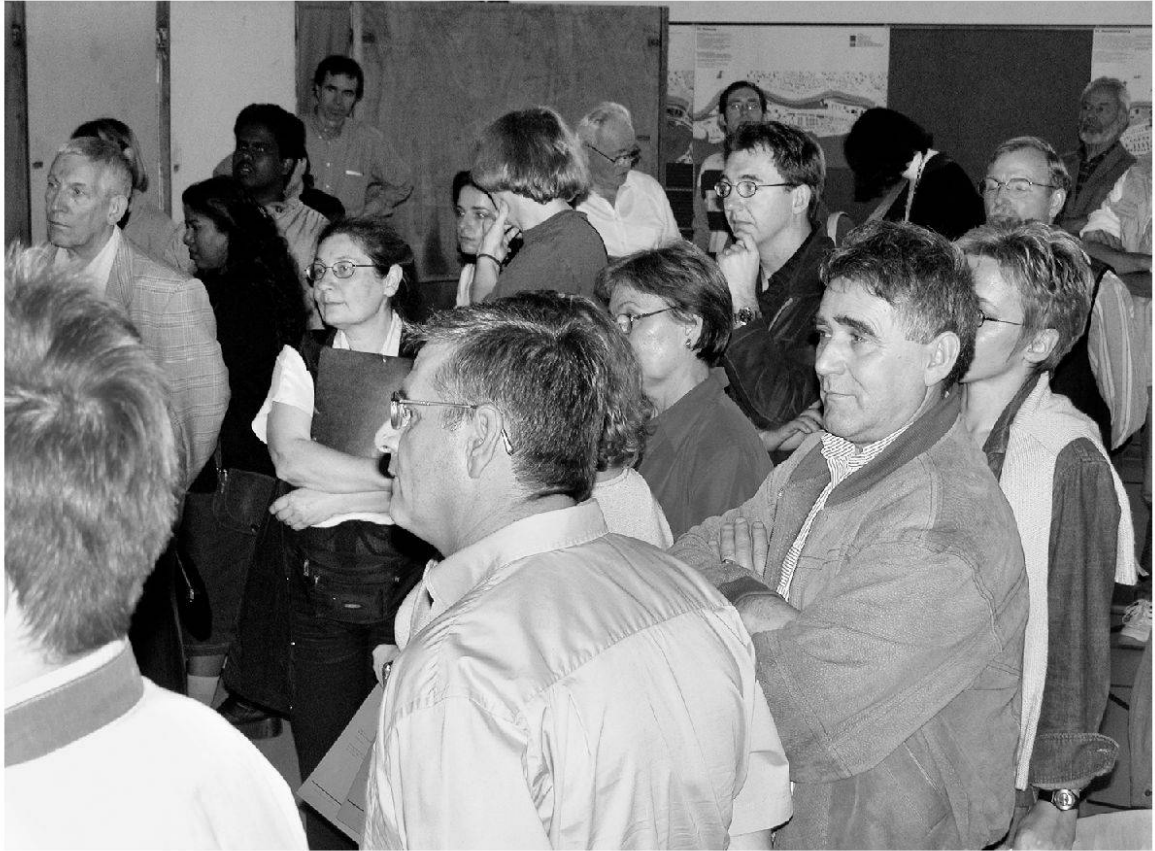
Diskussionsveranstaltung im Mai 2004.