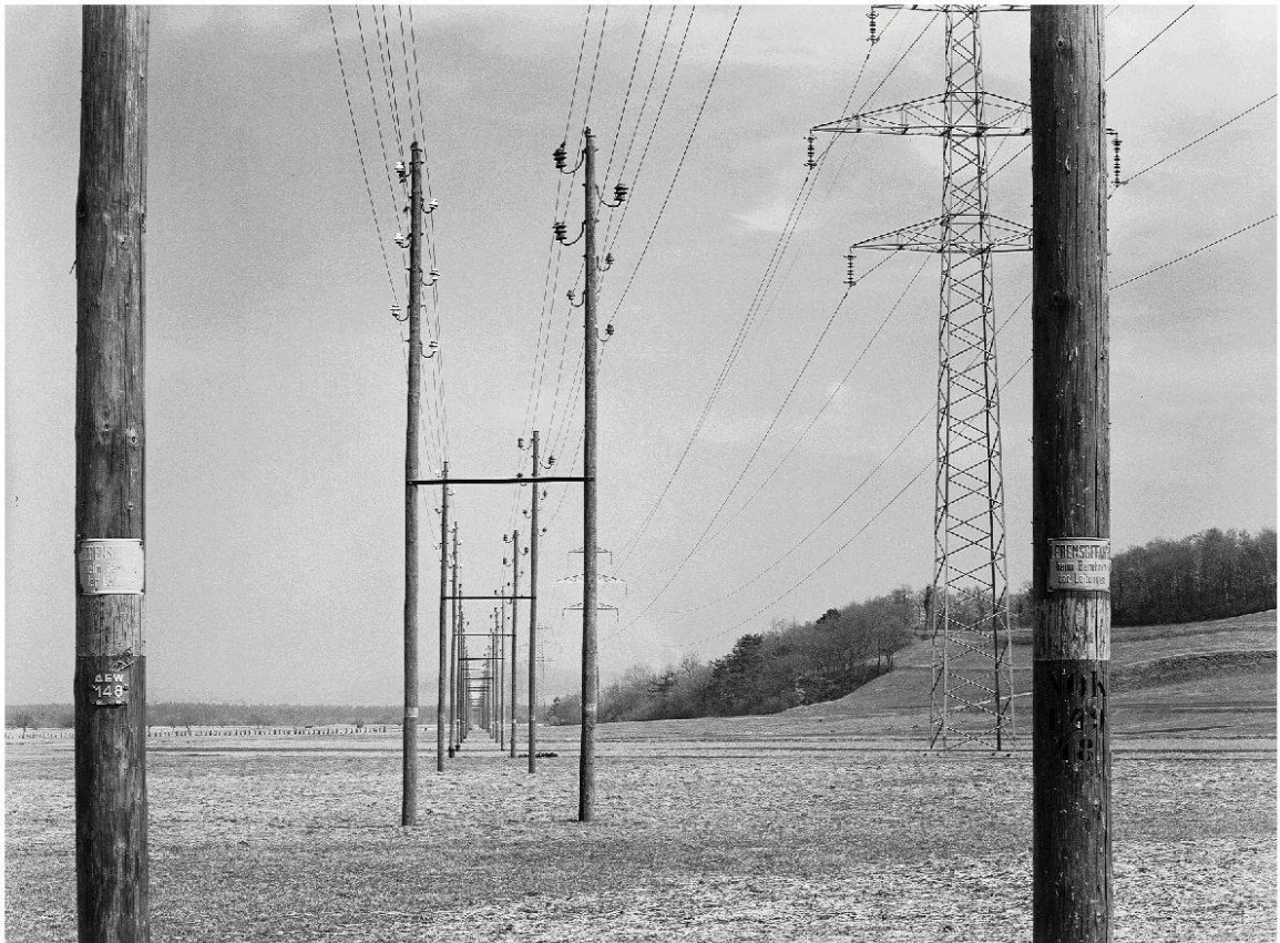
Bild 7: Werner Nefflen: Starkstromleitungen bei Rüfenach, 1954 (Sammlung Historisches Museum Baden, Q.01.6954).