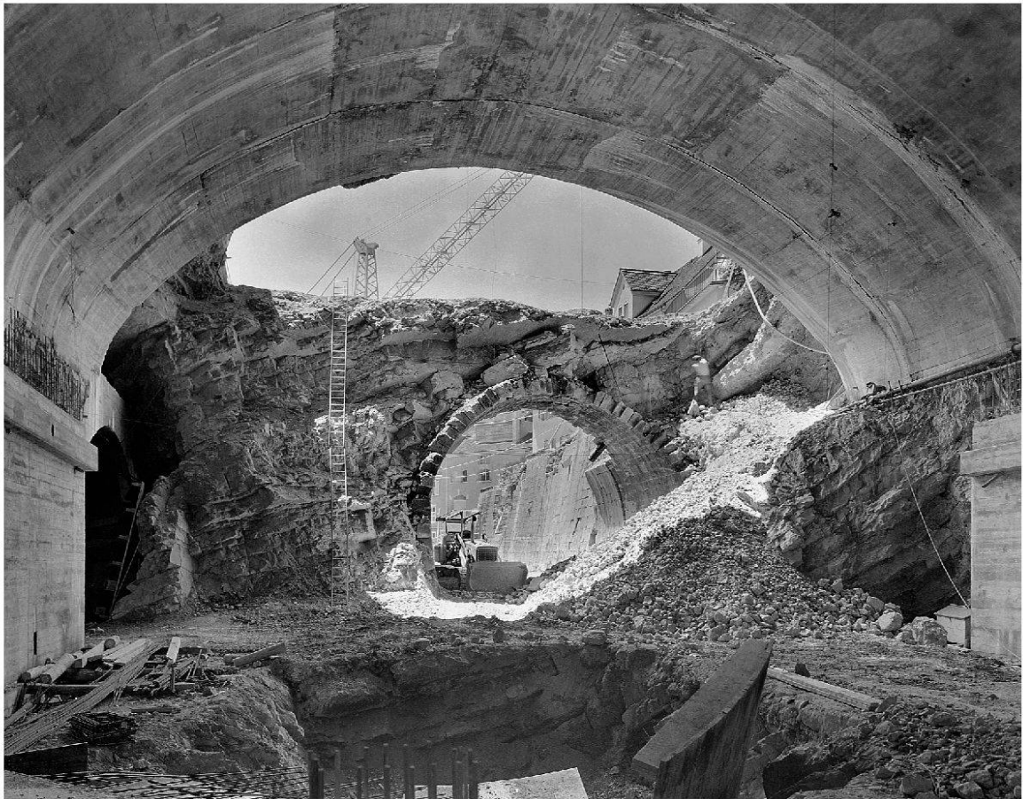
Bild 2: Werner Nefflen: Badener Verkehrssanierung 1963, Blick vom neuen Strassentunnel in den alten Bahntunnel (Sammlung Histo- risches Museum Baden, Q.01.11051D).