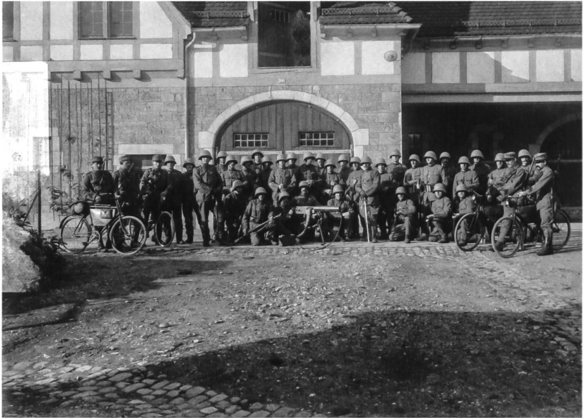
Die «Stadtwehr Baden» mit Maschinengewehren vor der Garage des Grand Hotel. Gebaut im Jahre 1876, blieb es bis zu seinem Abbruch 1944 das grösste Hotel im Bäderquartier.