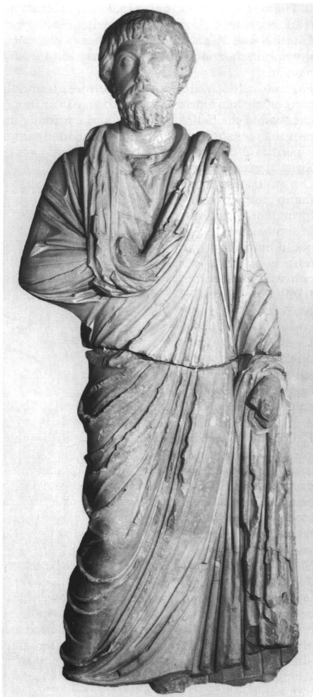
Statua ritratto di Neocle, marmo, 187 d.C.

- M. Karabelnik (red.), Aus den Schatzkammern Eurasiens. Meisterwerke antiker Kunst . Kunsthhaus Zürich, 1993 (Direttore: Felix Baumann).