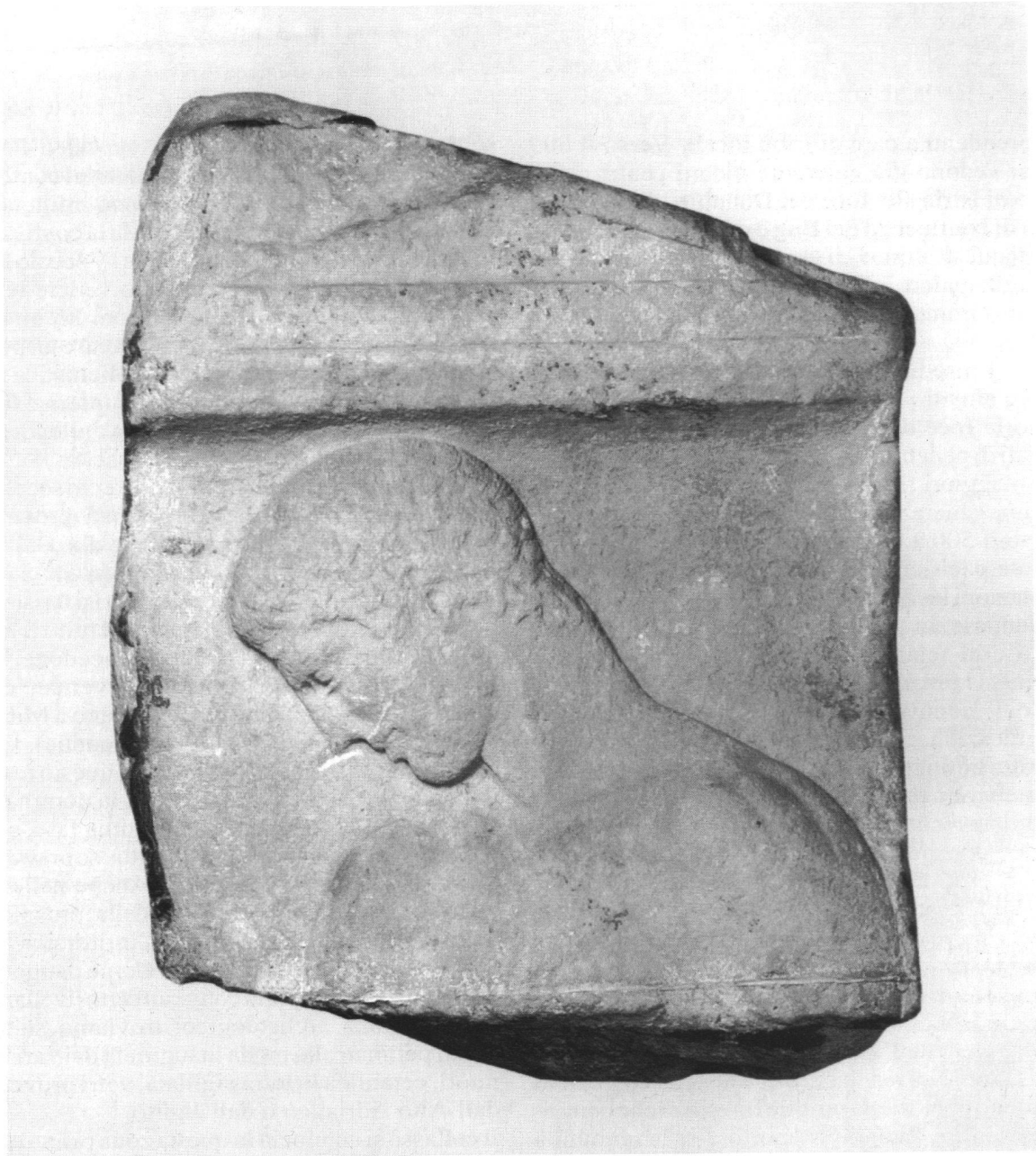
Frammento stele funeraria, marmo ca. 450 a.C.

greca, il che, oltre a conflitti fra centri contigui, dà origine, a partire dall'VIII secolo a.C., anche a un impressionante moto di colonizzazione.