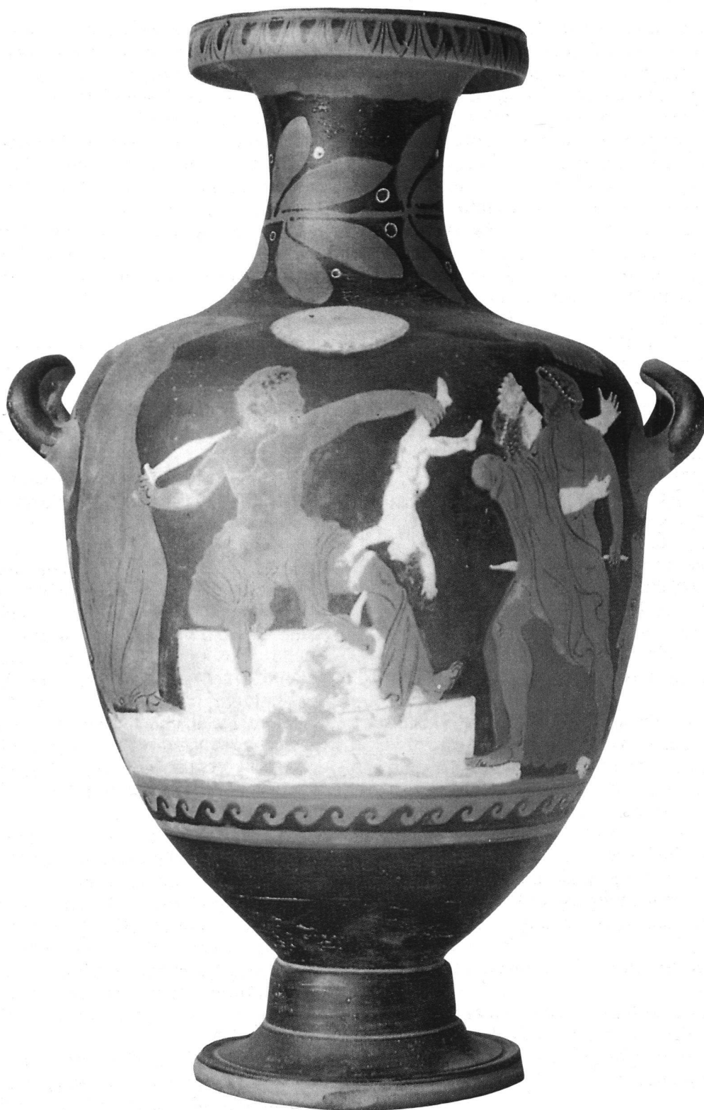
Vaso (hydria) italiota a figure rosse. Ultimo venticinquennio del IV sec. a.C. Napoli, Museo Archeologico Nazionale. Il vaso, rubato nel 1991 dal Museo, è stato recuperato a Benevento dalla Polizia di Stato nello stesso anno.