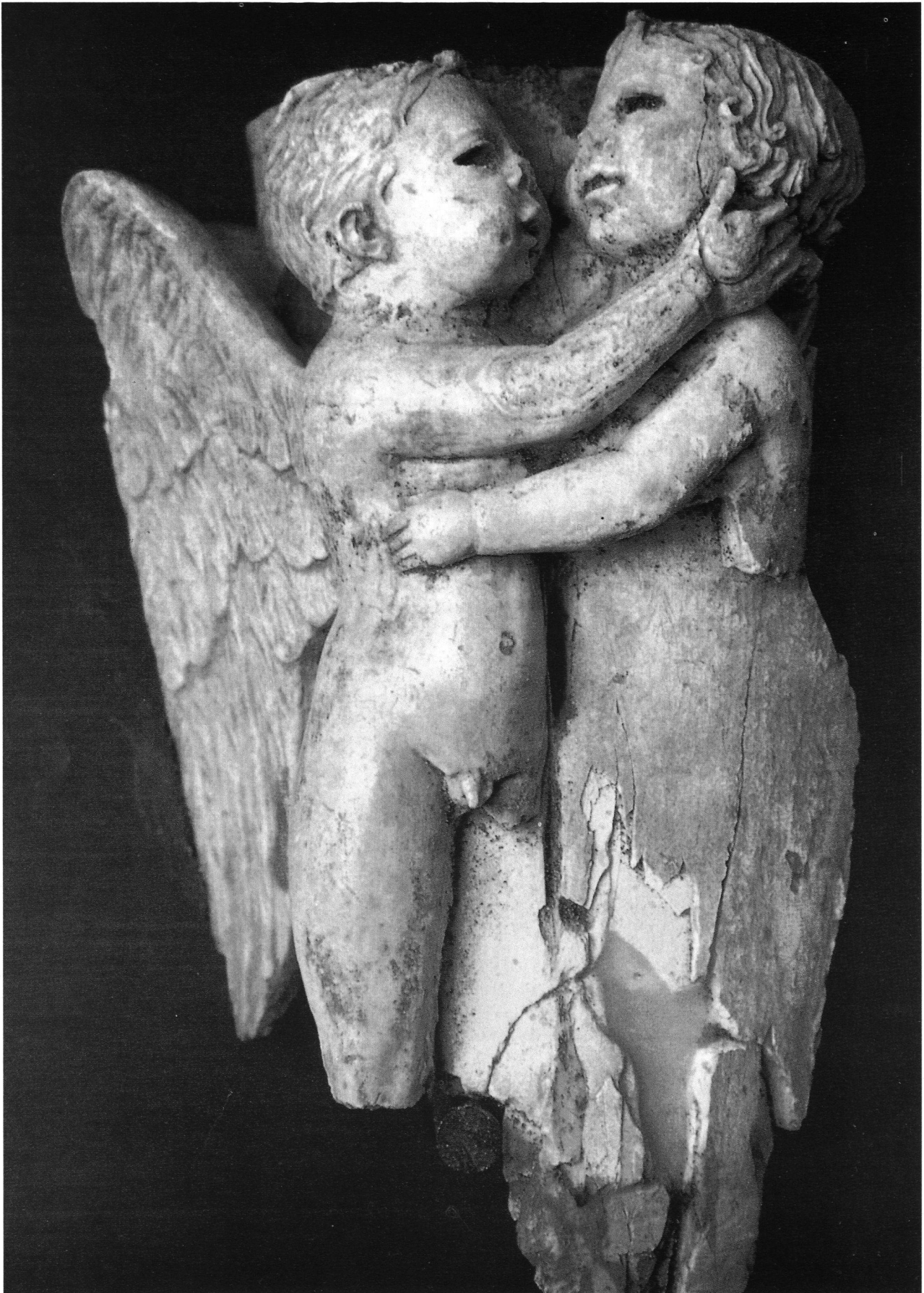
Elemento decorativo in avorio di un letto funerario da Aielli (l'Aquila), età augustea (fine I sec. a.C. / inizi I sec. d.C.) Trafugato nel dicembre 1982 dal Museo Nazionale Romano e recuperato nel maggio del 1983 dalla Guardia di Finanza