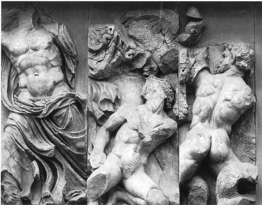
5. Fregio con Gigantomachia , particolare con Zeus in lotta con il gigante Porfirione. Catalogo Antikenmuseum, Berlino 1998, no. 35.

La battaglia di Bibracte (oggi Mont Beuvray fra Nièvre e Autun) ebbe, come sappiamo, un esito disastroso per gli Elvezi e i loro alleati. Delle 368.000 persone che secondo Cesare ( Bellum Gallicum I, 29) erano partite dall'altipiano svizzero ne ritornarono in patria non più di 110.000. A ciò si deve probabilmente lo spopolamento, sensibile ancora per generazioni, del territorio elvetico orientale, quello che si estende dalla confluenza di Aare e Reuss con il Reno fino al lago di Costanza. Il fatto nuovo per Roma era che il confine nord dell'Impero non erano ormai più le Alpi ma il Reno: confine che, per proteggere l'Italia, andava difeso. La difesa a lungo termine poteva però risultare effettiva solo se alle misure militari se ne accompagnavano altre che agissero a livello più