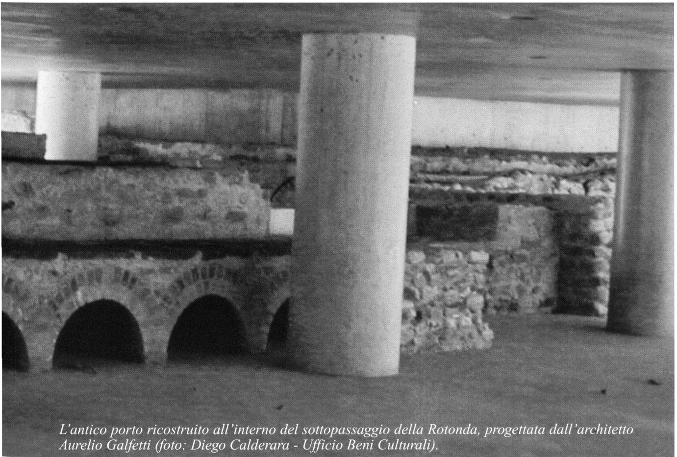
L'antico porto ricostruito all'interno del sottopassaggio della Rotonda, progettata dall'architetto Aurelio Galfetti.

Il percorso archeologico sotterraneo viene inoltre valorizzato con rilievi grafici esplicativi, volti a facilitare la lettura e l'interpretazione delle imponenti strutture murarie conservate.