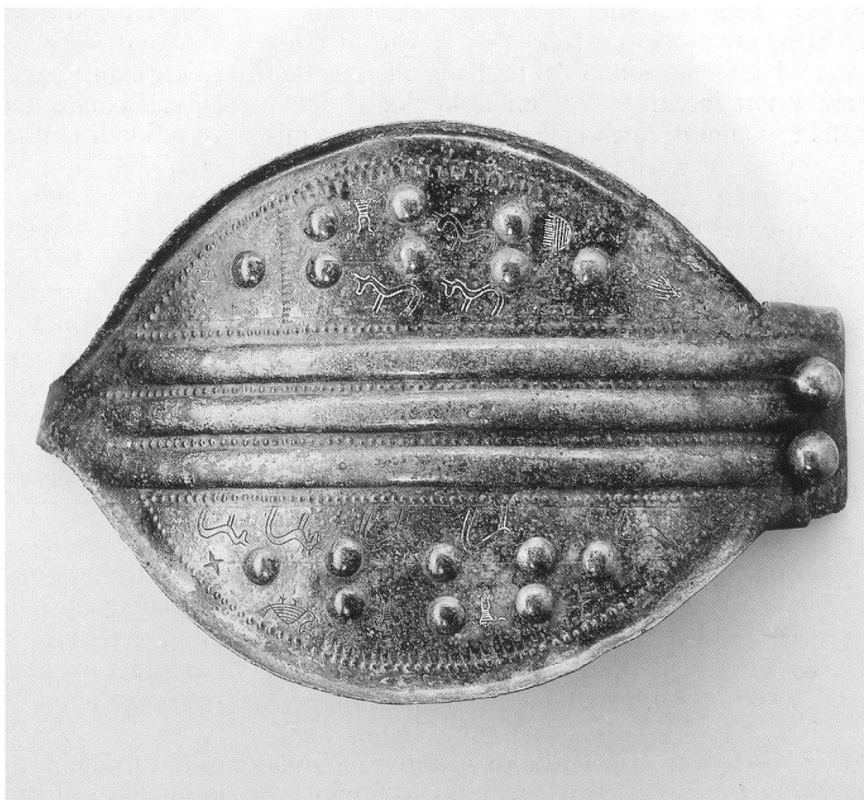
Fig. 1. Gancio da cintura femminile in bronzo da Arbedo-Cerinasca; V secolo a. C. (foto Museo Nazionale Svizzero, Zurigo).

I Leponti furono anche dei guerrieri, come testimoniano le numerose armi rinvenute per la maggior parte nella necropoli di Giubiasco, vicino a Bellinzona: spade e foderi, elmi, punte di lancia e asce da combattimento, ispirate all'equipaggiamento di altre popolazioni, in parte utilizzando elementi importati, in parte producendone imita-