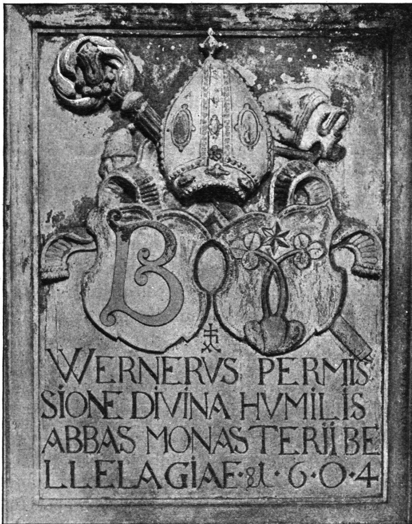
Abbildung 3. Wappenstein des Klosters Bellelay und des Abtes Werner Briselance.

dung noch deutlich wahrzunehmen. Die mit den heraldischen Farben geschmückten Skulpturen müssen sich vom weinroten Hintergrunde und dem grün und golden bemalten Rahmen kräftig abgehoben haben.