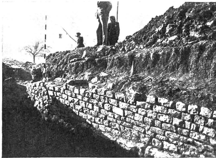
Bild 2. Ansicht der Mauer von Südosten.

Die Oberkante der angetroffenen Mauer lag nur etwa 40 cm unter der heutigen Oberfläche. Was lag näher, als die Mauer ein Stück weit zu verfolgen, an einer weitem Stelle wieder anzuschneiden, wiederum zu verfolgen, eine Mauerecke zu finden, und so nach und nach den oberflächlichen Grundriss des römischen Baues herauszubringen? Aber leider erwies sich dieser Arbeitsplan bald als undurchführbar. Wohl gruben wir der Mauer nach, suchten sie weiter oben wieder, aber je weiter östlich wir gruben, desto tiefer versank sie in der überlagernden mächtigen Lehmschicht. Dieser Teil der römischen Ruine wurde also nicht durch den oben erwähnten Erdschlipf be-