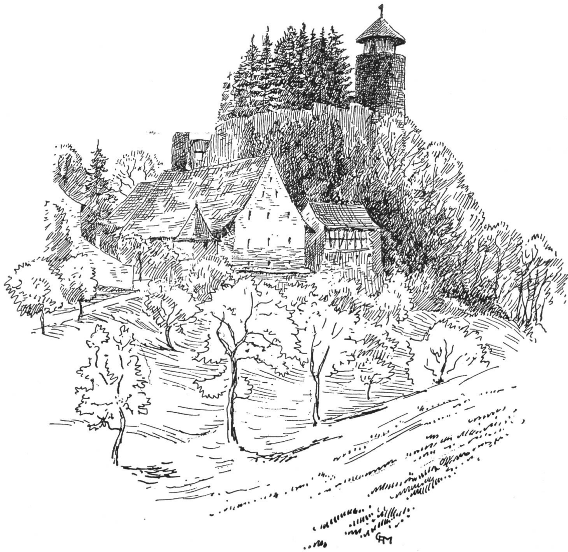
Bild 5. Ruine Birseck von Nordwesten, mit Vorhof und Schlosshof Federzeichnung von C. A. Müller

dem Grabe zu erheben scheint und die sich nach eben diesem Lichtstrahl aus der Höhe auszustrecken scheint. Wir folgen ihrem suchenden Blick in die Höhe; die Höhle weitet sich nach oben aus, und aus einer schmalen Ritze zuoberst im Gewölbe dringt ein heller Tagesschein herunter. «Das Licht, das da dringt in die finstere Grabesnacht». Ein Sinnbild belehrt uns in feiner Weise: eine zerbrochene Sanduhr von einer Schlange umwunden: es ist die Zeit, die von der Ewigkeit überwunden wird. — Wir erinnern uns, dass wir beim Aufstieg zum Schloss unter jenem Altartisch die diskret versteckte Oeffnung zu der Licht spendenden Ritze entdeckt hatten. Man kann sich leicht vorstellen, welche Ueberraschung es für den ahnungslosen Besucher bedeutete, wenn plötzlich aus der Tiefe der Grabesgrotte ein Bläserchor oder ein Gesangchor zu vernehmen war.