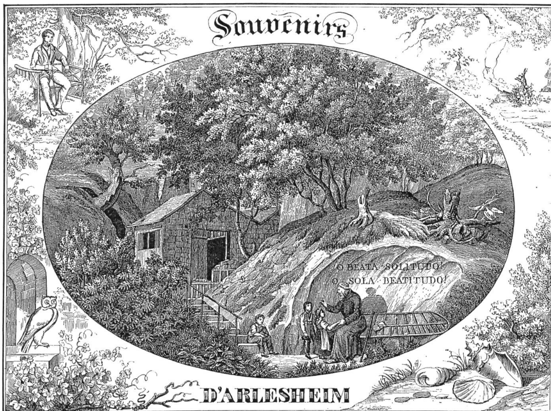
Bild 1. Titelbild der Mappe «Souvenirs d'Arlesheim» der Lithographie Hasler u. Cie. Basel

In England war man zu dieser überreizten Zeit auf einen ganz nüchternen und praktischen Kult der ländlichen Erholung gekommen. Man wusste sich dort in ländlicher Abgeschlossenheit von den geschäftlichen Anstrengungen auszuruhen. Ein Engländer beschrieb damals die Wonne des « Englischen Gar-