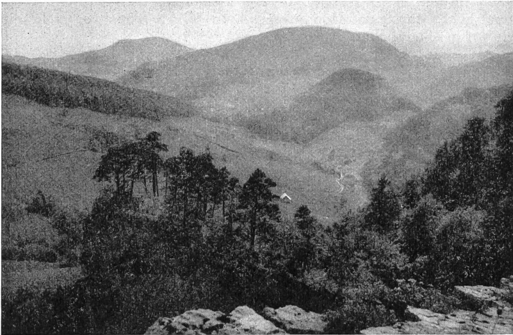
Bild 4. Blick von der Ankenballen in das Tal des Chilchzimmerbaches. Im Hintergrund Chräiegg und Bereten.

Er kämpfte aber auch für eine Bahnverbindung. Als 1858 die Hauensteinstrasse von Tag zu Tag mehr verödete, trat er in einer Sitzung für den Bau einer Pferdebahn von Liestal nach Langenbruck ein, allerwenigstens bis Waldenburg, gab aber diesen Plan bald zugunsten einer Dampfbahn auf, welche die Zentralbahn als Ersatz für den verlorenen Durchgangsverkehr auf der