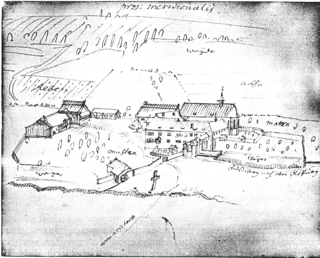
Bild 2. Kloster Olsberg im Jahre 1680. G. F. Meyers Federzeichnung stellt das nach den Verwüstungen des 30jährigen Krieges restaurierte Zisterzienserinnenstift mit Mühle, Fischweiher und Oekonomiegebäuden, von der Südseite her, dar.

man aus unerfindlichen Gründen in ganz andere Zeiten versetzt. Eine undatierte Urkunde, von der man früher glaubte, sie sei ums Jahr 1114 ausgestellt worden, erweist sich als ein Dokument aus der ersten Hälfte des 13. Jahrhunderts.