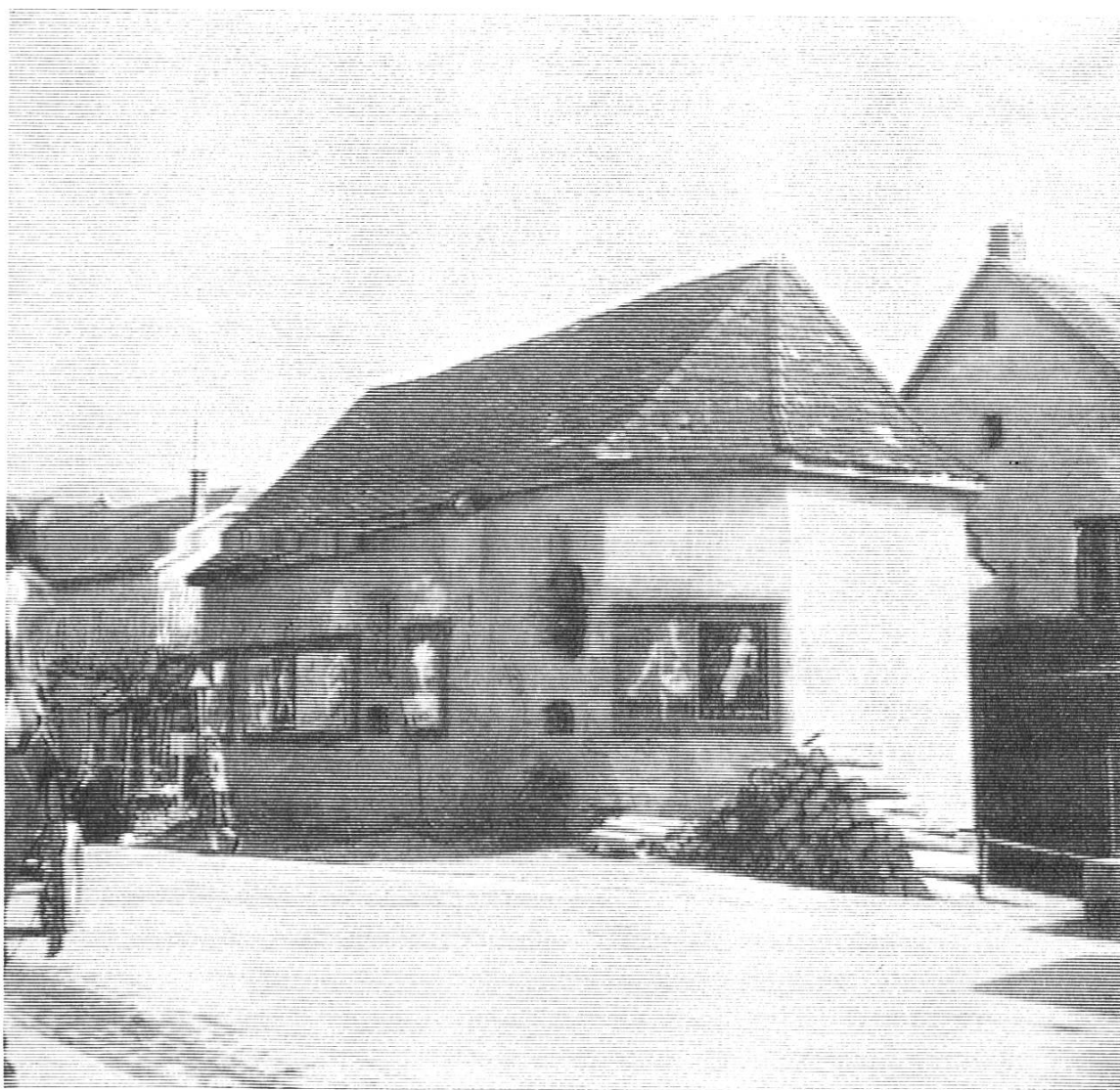
Bild 2. St. Laurentius-Kirchlein in Grellingen. 1771 erbaut nach den Plänen von H. G. Anderauer; für den Gottesdienst verwendet bis 1835, nachher Lagerraum eines Baugeschäftes, zwischen 1930 und 1940 abgetragen.

halten werden und es wurde der Neubau der Kirche anbefohlen 5 . Noch im gleichen Jahr gestattete der Bischof, mit dem Bau des Langhauses nach den genehmigten Plänen (von Anderauer) zu beginnen, den alten Chor aber, da Solothurn jede Zahlung verweigerte, stehen zu lassen. Dazwischen trat nun das Ereignis der Französischen Revolution (1792—1815), so dass sich der Weiterbau verzögerte. 1804 war jedoch das Langhaus der Kirche nahezu vollendet. Das war mit ein Grund, dass sich der damalige Pfarrer (Georg Floribert Froidevaux 1781—1812) dagegen sträubte, die begonnene Pfarrkirche aufzugeben und den Dom zu erwerben, der inzwischen von den Franzosen zum «bien national» erklärt und versteigert worden war. Nach langem Widerstand entschloss sich die Gemeinde im Jahre 1814 (nach der Resignation von Pfarrer Froidevaux 1812; er starb als Resignat in Arlesheim im Jahre 1819 und