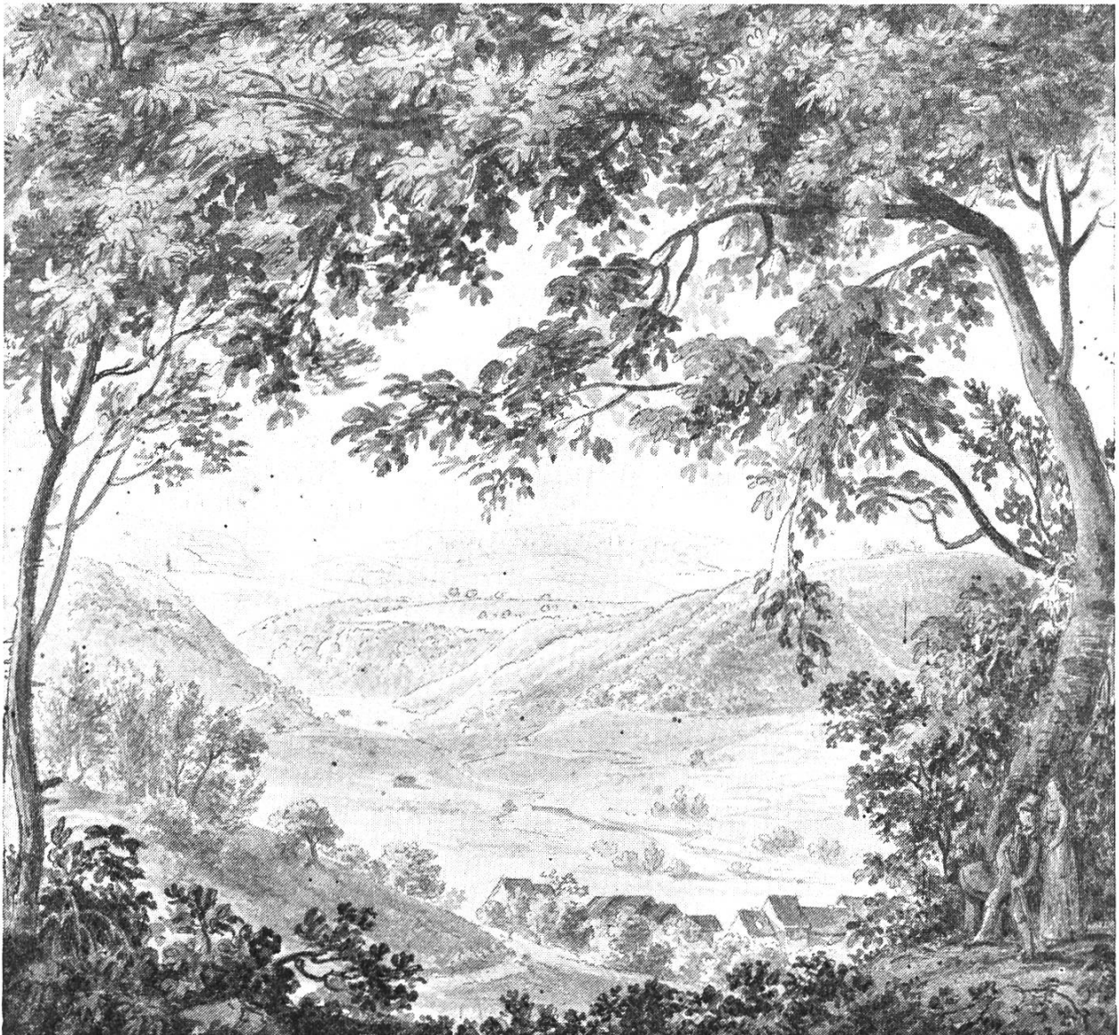
Bild 1. Eital mit Tecknau . Aquarell eines Anonymus, 18,5 mal 17,1 cm, im Kantonsmuseum Liestal. Blick vom Chueni südlich Ärntholden. Im Mittelgrund Tecknau und Eital (talaufwärts), links Oedenburg, rechts Hochebene von Hinterholz und einige Häuser von Rünenberg. Im Hintergrund in schwachen Umrissen: Zigflue, Sodchopf, Burgflue.

von der Kirche mit dem mächtigen Käsbissenturm. In den letzten Jahrzehnten hat sich das Dorf an den Aussenseiten durch Wohn- und Industriequartiere stark erweitert; auch der Bau der neuen Hauensteinlinie mit ihren Aufschüttungen und Einschnitten hat die orographischen Verhältnisse der Umgebung augenfällig verändert.