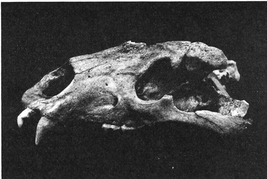
Bild 3. Schädel eines Braunbären aus dem Schelmenloch (Lauwil). Grabung von Dr. E. Roost 1962. Kantonsmuseum Baselland.

Im Jahre 1962 untersuchte eine Lehrergruppe unter Führung von Dr. E. Roost die Spalthöhle Schelmenloch am Vogelberg bei Lauwil. Nach mündlicher Ueberlieferung sollen dort die letzten Bären der Umgegend gehaust haben; auch ist die Stelle, wo der Bär von 1798 erlegt wurde, nur etwa einen Kilometer davon entfernt. Die Grabung brachte das Skelett eines mittelgrossen Braunbären zutage (Bild 3); ausserdem fanden sich Skeletteile zweier weiterer Bären und anderer Säugetiere. Der Bär war als Jagdwild begehrt, sein Fell gesucht, und die Tatzen galten als Leckerbissen. Der Schaden an Vieh war nie bedeutend, braucht der Bär doch seine Riesenkräfte vor allem, um Steine um-