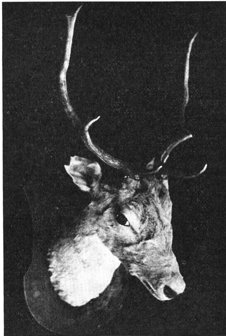
Bild 1. Kopf eines Damhirsches, erlegt 1891 im Bärengraben (Reigoldswil). Sammlung der Realschule Reigoldswil.

ren. Weiter muss ein Hirsch erwähnt werden, dessen Kopf in der Ortssammlung Reigoldswil aufbewahrt wird. Nach einem Zeitungsausschnitt aus der BZ 3 soll er vom Reigoldswiler Jäger Gustav Schneider, dem späteren Ständerat, im November 1891 am alten Wasserfallenweg erlegt worden sein. Die Jagdbeute wird als ein prachtvoller, weissgefleckter Dreier mit 60 cm langem Geweih, einer Höhe von 1,05 m und einem Gewicht von 146 Pfund beschrieben. Wie die Fama erzählt, war der glückliche Schütze aber nicht G. Schneider, sondern der nicht der Jagdgesellschaft angehörende Stöckmattheiri — ein interessanter Parallellfall zum Walliser Wolf von 1947, wo eben-