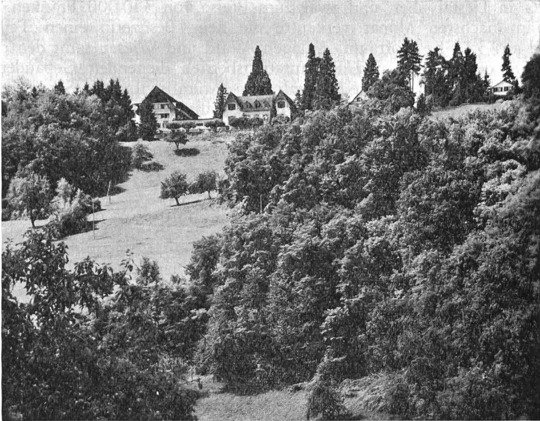
Bild 2. Der Binenberg (Bienenberg) von Nordosten.

gen jüdische Flüchtlingsfrauen ein, vor allem werdende Mütter. Ihnen folgten russische Flüchtlingsfrauen und schliesslich konnten sich bis 1948 kriegsgeschädigte Auslandschweizerfamilien auf dem Binenberg erholen.