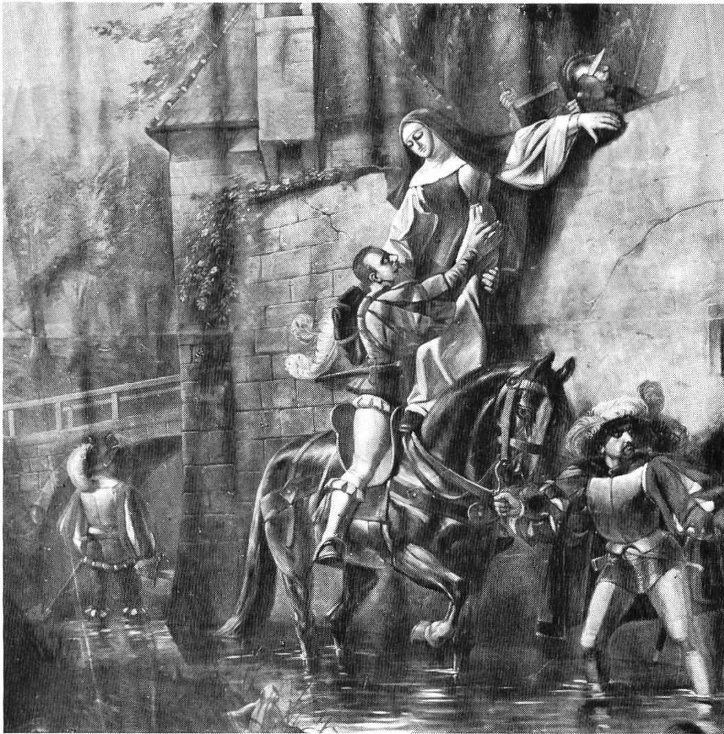
Bild 2. Entführung der Nonne Barbara im Jahre 1487. Nach einem grossformatigen Oelbild von Karl Jauslin, heute im Heimatmuseum Muttenz deponiert.

berstadt sowie die dritte Basler Ausgabe der «Postille» des Nicolaus Lyranus. Auch als Dichter und Briefeschreiber hat er sich hervorgetan.