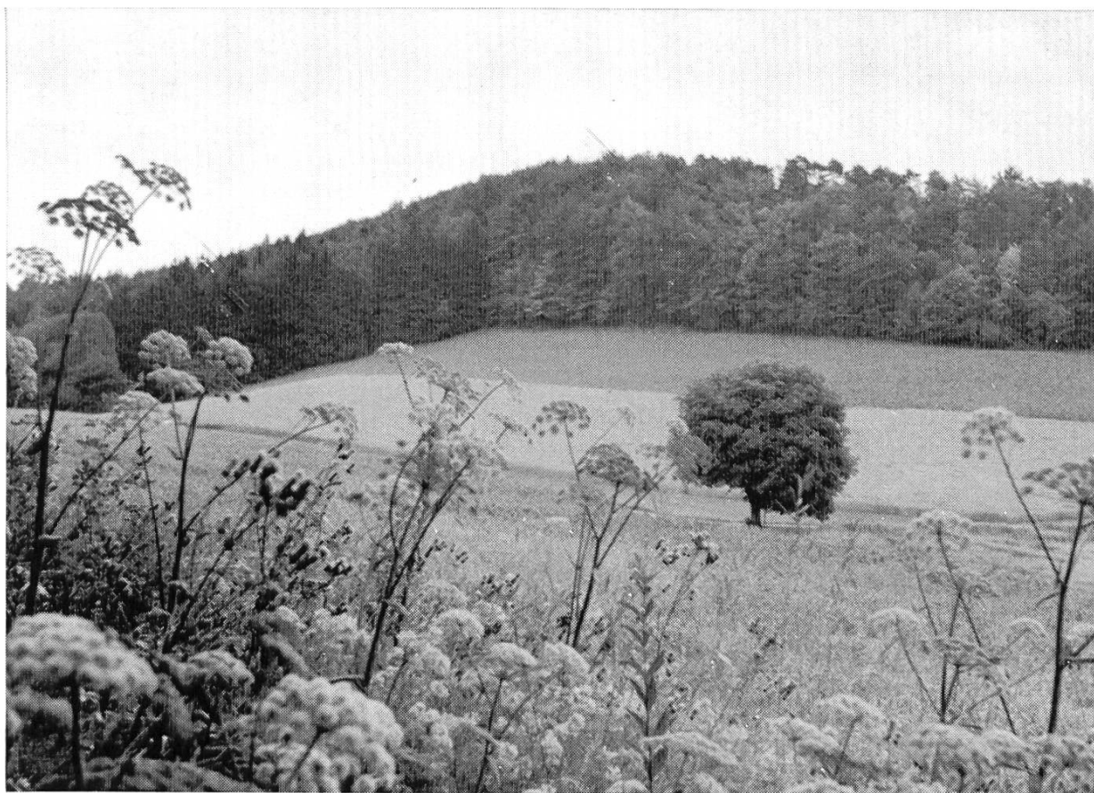
Blick vom Hinteren Holzenberg auf die Gegend Gauset—Chüeweid. Bei der Linde im Feld mündet der Weg von Reigoldswil in die Strasse Holzenberg—Seewen ein. Im Hintergrund der Waldstreifen vom Hochgauset.

4. Wenn schon die Protokolle in Schriftsprache verfasst sind, dringen doch unverkennbar dialektische Formen durch, die auch heute noch gebraucht werden: eine Pfeife Tabak eingefüllt (e Pfyfe Tubak yfülle), es ist tumber worden (zu dimbere, feischtere: dämmerig werden), Gscheüch (Gschüüch: Person mit abstossendem Aeussern, habs (das Ross) schier nicht fortbringen können (schier: beinahe), ein schwarzer Mann, der dort umher trumpe (zu trampen: plump treten), eine Heitere (e Heiteri: eine helle Stelle), es seien ihme die Haar obsich gestanden (d Hoor obsig: aufwärts gestanden, es habe etwas geschrauen (es het öppis gschroue: geschrien), sei auf Basel mit seinem Bueblin (mit sym Büepli), er habe hören gar grüseli schreyen (grüseli: heftig, grausig), in der Dickhe eines grossen Sagbaumes (Sagbaum: entrindeter Baumstamm in der Sägerei).