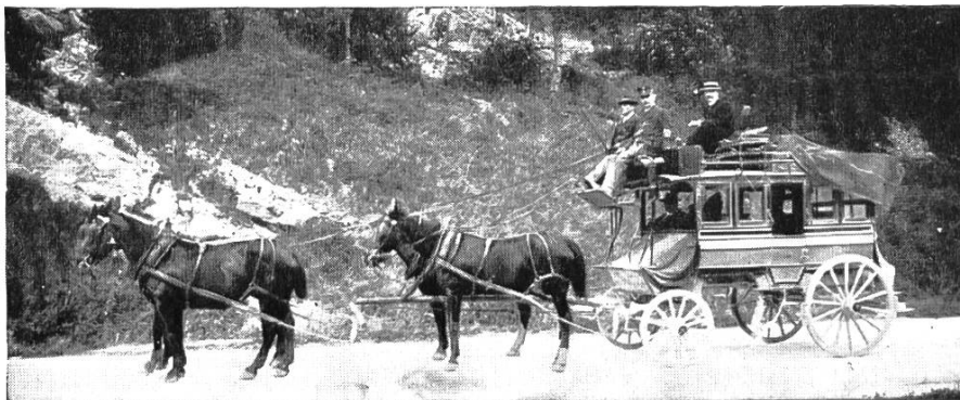
Bild 8. Die alte Langenbrucker Post um 1910. Täglich zwei Kurse von Waldenburg nach Langenbruck bis zur Einführung des Postautos (1917).