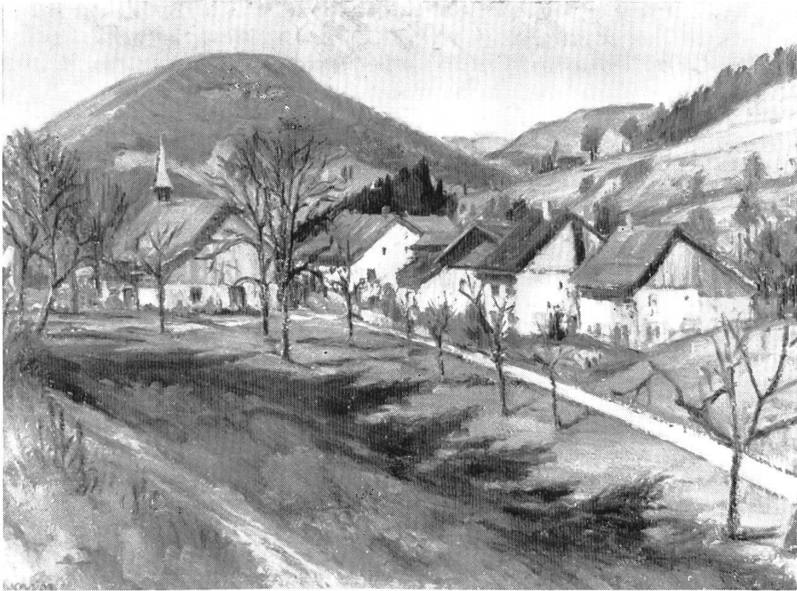
Bild 3. Bärenwil mit Wannenflue, gegen Westen. Das Haus mit dem Dachreiter Restaurant Chilchli. Nach einem Oelbild des Bärenwiler Malers Albert Schweizer (1885—1948) im Disteli-Museum Olten. Aus BHB 6, S. 77.

der über den Kirchhof führte, nach Hägendorf. Dort fing das Steigen und Ziehen erst recht an, doch langte die Ladung immer gut zu Hause an.