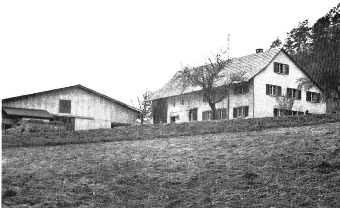
Bild 2. Hof Gotterbarm. Aufnahme 1976 von Paul Suter. Die alleinstehende Scheune wurde 1970 erbaut, nachdem das Wirtschaftsgebäude 1938, das Wohnhaus 1955 umgebaut und erweitert worden war (Zweifamilienhaus). Gesamtfläche des Hofgutes 12 ha, Viehbestand 14 Kühe und einige Rinder, vor 100 Jahren bei einer Fläche von 3 ha 2 Kühe und einige Ziegen.

ten wir Kinder mit der Mutter im Frühling oft von Wegrändern und Waldlichtungen Gras herbeiholen. Im Schwängiloch, in der Höll und anderwärts liess sich das gut bewerkstelligen, ohne dass jemandes Eigentum verletzt wurde. Für die Ziegen holte ich am nahen Waldrand und in benachbarten Weidhagen manchen Arm voll frischbelaubter Zweige, ein Futter, das den Meckerern von anno dazumal — die heutigen würden kaum Laub fressen — gut mundete.