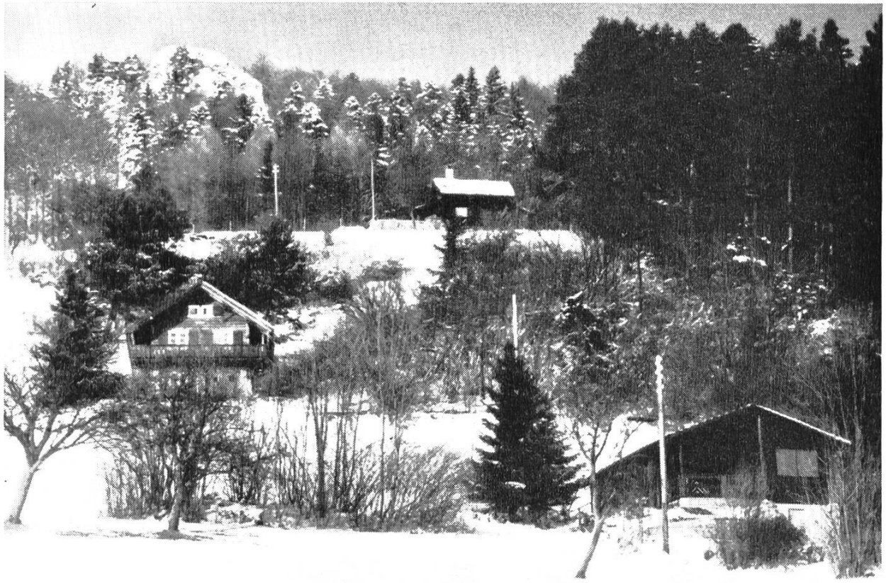
Bild 4. Wochenendhäuser auf der Allmend bei Bärenwil. Im Hintergrund Schwängiflüeli, 979 m ü. M. Aufnahme 1967 von Peter Suter. Aus Regio Basiliensis 1968, S. 108.

befindliche Brunnen gewöhnlich. Dann mussten wir das unentbehrliche Nass beim sogenannten Brünneli, jenem Wasserloch, das uns auch als Fischbehälter diente, holen. Das war keine kleine Arbeit, da auch das Vieh getränkt sein wollte. Zum Wassertransport stiessen wir eine starke Querstange durch die beiden Handhaben eines Wasch- oder Chnötschzübers. An dieser Querstange wurden zwei gleich lange Längsstangen befestigt, an deren Enden die beiden Träger anfassten. Begreiflich war das Tragen des grossen Zubers voll Wasser keine Kleinigkeit, zumal die Verbindung mit den Tragstangen nicht so fest war, dass er nicht hin und her schaukeln konnte. Im Sommer ging jedoch das Wassertragen noch an; im Winter aber war es eine rechte Plage, wenn der Biswind scharf von Osten über das Gelände strich. In der Küche war ein Hühnergätter installiert. Die Decke desselben diente als Wasserbank. Darauf stand der Wasserzuber mit dem Gätzi, das heute ein unbekannter Begriff geworden ist. Oft holte die Mutter auch einen kleinen Zuber voll Wasser am Brunnen im Dörflein. Sie konnte sehr gut auf dem Kopfe tragen. Ohne dass sie den Zuber mit der Hand festhielt, legte sie die etwa zehn Minuten lange Strecke zurück.