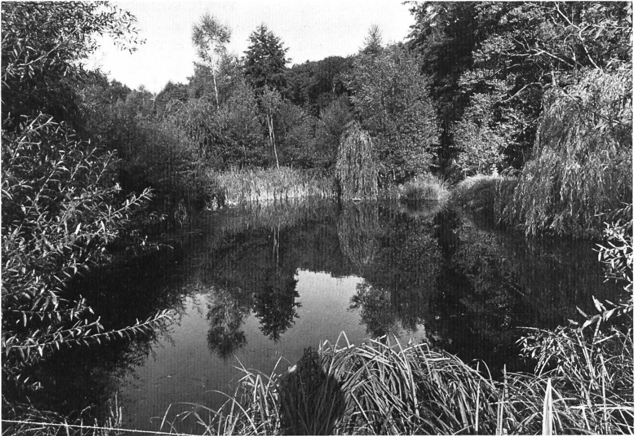
Bild 1. Naturschutzweiher Mooswasen bei Therwil.

von Liestal angelegt worden, die aber gleichzeitig auch als Fischweiher genutzt worden sind. Im Jahre 1850, beim Bau des Regierungsgebäudes, wurde ein Teil der Stadtmauer und der Costenzerturm abgebrochen und mit dem Abbruchmaterial der damals noch offene, obere Weiher aufgefüllt (heute «Allee»).