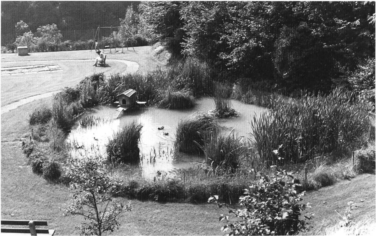
Bild 3. Naturschutzanlage Hirzenfeld bei Läuelfingen.

Ein immer grösser werdendes Problem bildet der Unterhalt und die Pflege der Naturschutzweiherr. Grundsätzlich ist immer der Eigentümer für Pflege und Unterhalt verantwortlich. Ist eine Einwohner- oder Bürgergemeinde Eigentümer, so können die notwendigen Arbeiten z.B. an einen kommunalen Natur- oder Vogelschutzverein delegiert werden, falls nicht Gemeindearbeiter dafür eingesetzt werden können. Besonders bei grösseren Weiherrn übersteigt aber häufig der Arbeitsanfall die Möglichkeiten der für Pflege und Unterhalt Verantwortlichen. Schon oftmals hat in solchen Fällen die Unterhaltsgruppe der Abt. Wasserbau des Tiefbauamtes die notwendigen Arbeiten ausgeführt. Braucht es jedoch ausnahmsweise bei grösseren Weiherrn den Einsatz von schweren Maschinen, so müssen die Arbeiten an Tiefbauunternehmer vergeben werden. Die meistens hohe Kosten für einen solchen Einsatz werden dann ganz oder teilweise aus einem dem Amt für Naturschutz und Denkmalpflege jährlich zur Verfügung stehenden Budgetbetrag beglichen.