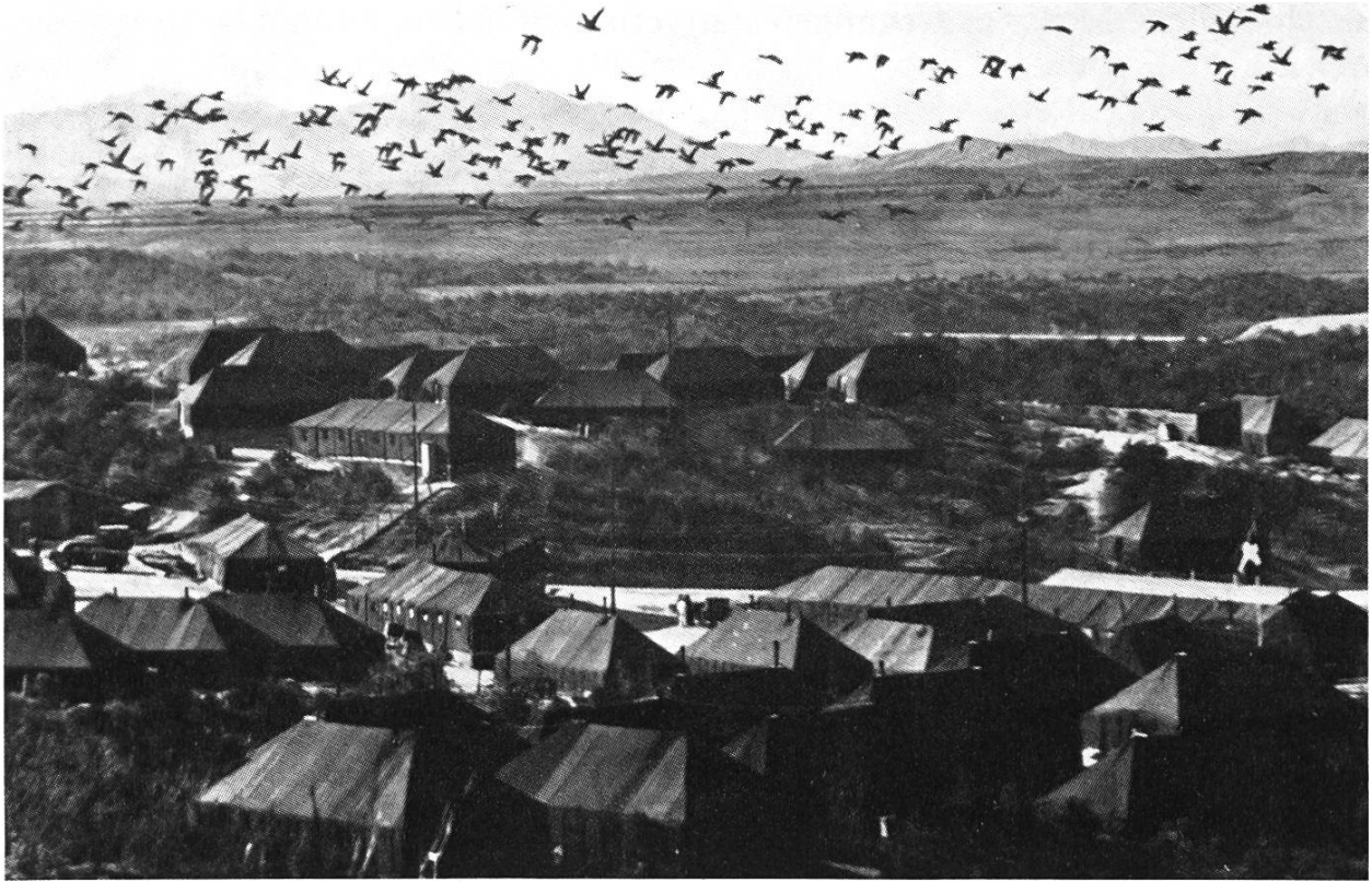
Bild 3. Wildgänse überfliegen das Lager von Panmunjom (Korea).